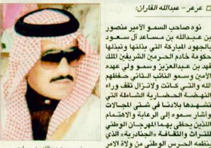
منصور بن عبدالله بن مساعد

تؤد صاحب السمو الأمير منصور بن عبدالله بن مساعد آل سعود بالجهود المباركة التي بذلتها وتبذلها حكومة خادم الحرمين الشريفين الملك فهد بن عبدالعزيز وسمو ولي عهده الأمين وسمو النائب الثاني حفظهم الله والتي كانت ولا تزال تلف وراء النهضة الحضارية الشاملة التي تشهدها بلادنا في شتى المجالات وأشاد سموه إلى الرعاية والاهتمام اللذين يحظى بهما المهرجان الوطني للتراث والثقافة «الجندرية» الذي ينظمه الحرس الوطني من ولاية الأسر في بلادنا مؤكداً سموه أن المهرجان يعد تظاهرة ثقافية يفتخر بها خاصة وأن هذه التظاهرة تجمع الماضي المجيد والحاضر الزاهر وبحضرها المثقفون والأدباء والمؤرخون في كل عام من دول مختلفة من العالم ويضيف سموه أن المهرجان ملتقى فكري وثقافي يعكس الصورة المشرفة لبلادنا سواء في الماضي البعيد أو الحاضر أو المستقبل وأعرب صاحب السمو الأمير منصور بن عبدالله بن مساعد عن إعجابيه وسروره بهذه التظاهرة المتنوعة الأنشطة والفعاليات التي تحظى بالإهتمام والرعاية من قبل القائمين على المهرجان مؤكداً سموه أن هذه التظاهرة تعد مفخرة لكل أبناء المملكة العربية السعودية وتؤد سموه بالجهود المباركة التي بذلتها ويبدئها صاحب السمو الملكي الأمير بدر بن عبدالعزيز نائب رئيس الحرس الوطني ورئيس اللجنة العليا للمهرجان الوطني للتراث والثقافة وصاحب السمو الملكي الفريق أول ركن الأمير متعب بن عبدالله بن عبدالعزيز نائب رئيس الحرس الوطني المساعد للشؤون العسكرية نائب رئيس اللجنة العليا للمهرجان الوطني للتراث والثقافة والتي كانت ولا تزال تلف وراء نجاح هذه التظاهرة الثقافية خلال الـ 18 عاماً الماضية.