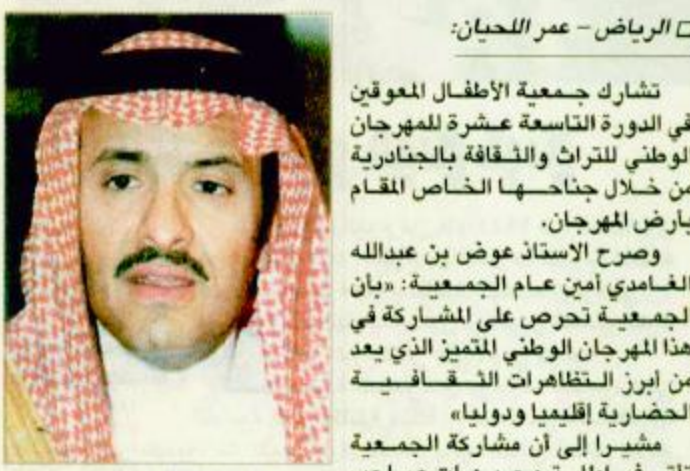
الأمير سلطان بن سلمان