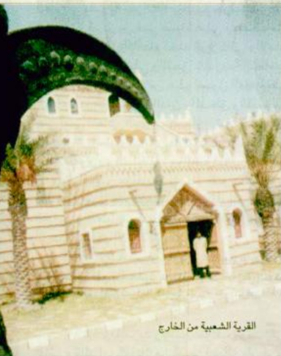
القرية الشعبية من الخارج

أكملت منطقة نجران كافة استعداداتها على أرض المهرجان الوطني للتراث والثقافة فقد أنهت المنطقة جميع الاستعدادات للمشاركة في المهرجان وذلك من خلال جناح منطقة نجران الدائم الذي تم تخصيصه لعرض تاريخ وتراث المنطقة وما تتميز به منطقة نجران من تراث وأصالة، ويضم الجناح بين جنباته عيانات من الأسلحة التقليدية والقديمة والأدوات المنزلية والحلي النسائية، إضافة إلى أنه يضم ركناً يمثل الماني القديمة التي تتميز بها منطقة نجران والمكونة من الطين إضافة إلى ركن يتحدث عن الآثار التي تشتهر بها منطقة نجران. كما يضم الجناح عرضاً تلفزيونياً يتحدث عن منطقة نجران ومراحل