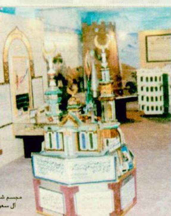
مجلس شجرة آل سعود