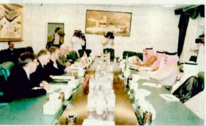
لدى استقبال سموه وزير خارجية الدنمارك

الفصل: بكل تأكيد الخطر موجود واتمنى ان احسن مسخطنا في هذا التقدير، ونحن هنا لسنا لتكافح هجمات الارهابيين السابقة بل نحن نامل في ان تكافح ما قد يحدث في المستقبل للحد من حدوث الارهاب ومني حدث فذلك قدر، ونحن سنستخذ التدابير للحيلولة دون وقوعها، وجهود الارهابيين تشمل المنطقة، والخطر كبير ليس في المملكة فحسب ولكن في جميع دول العالم وحول سؤال عن كيفية العمل للحد من قيام صفوف جديدة من الارهابيين أكد سموه ان ازالة الارهاب ليس مطمح او مسؤولية المملكة العربية السعودية فقط وإنما هو مطمح عالمي.