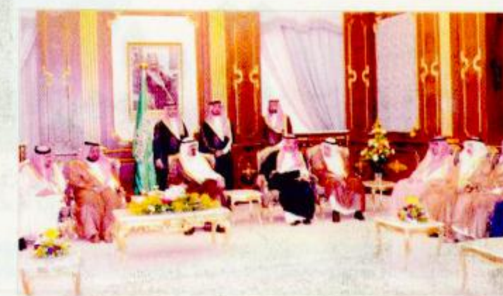
الرياض - واس:

معالي وزير خارجية الدنمارك الدكتور بيرستنج مولر خلال استقبال سموه له ومرافقيه في مكتبه بالديوان الملكي بقصر اليمامة أمس الأول. كما نقل معاليه لصاحب السمو الملكي الأمير عبدالله بن عبدالعزيز تعازي دولة رئيس وزراء الدنمارك في ضحايا التفجيرات الأثمة التي وقعت في مدينة الرياض الأسبوع الماضي. وحضر الاستقبال صاحب السمو الملكي الأمير سعود الفيصل وزير الخارجية وصاحب السمو الملكي الأمير عبدالعزيز بن عبدالله بن عبدالعزيز رئيس وزراء الدنمارك سمو ولي العهد وسمو وزير الخارجية الدنماركي لدى المملكة سغن ايريل فور دوج.