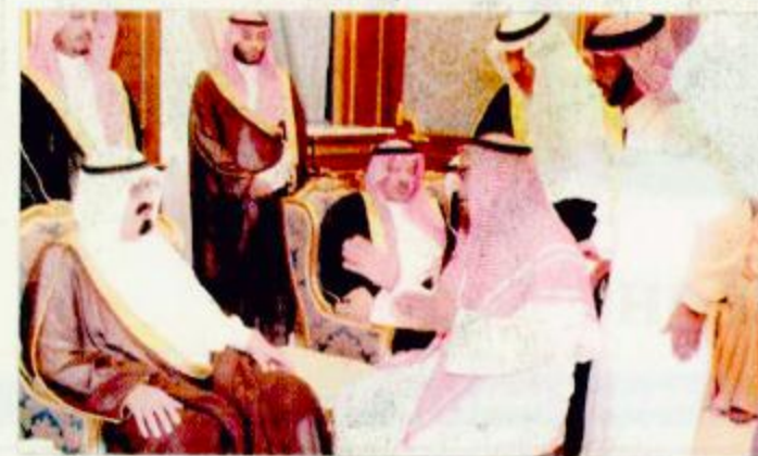
سمو ولي العهد يستقبل ذوي ضحايا التفجيرات