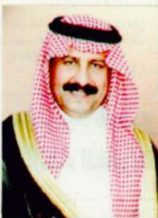
الأمير سلطان بن محمد

تستقبل روضة الأمير سلطان بن محمد بن سعود الكبير بمعهد العاصمة المنويجي هذه الأيام الأطفال الراغبين الالتحاق للدراسة بها كمرحلة أولى للتسجيل والتي تنتهي بنهاية شهر ربيع الأول على أن يستأنف التسجيل في مرحلة ثانية بعد عودة المعلمين يوم السبت ١٤٢٤/٦/٢٥ هـ علماً أن تقديم الأوراق يتم في إدارة القبول والتسجيل بالإدارة العامة للمعهد. الجدير بالذكر أن الروضة تحظى بإقبال كبير نتيجة لتصميم مستواها وتوفرها كل ما يمكن الطفل اكتساب المعرفة الأولية.