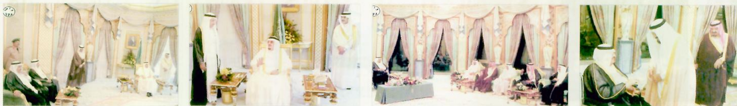
خادم الحرمين الشريفين لدى استقباله سمو النائب الثاني