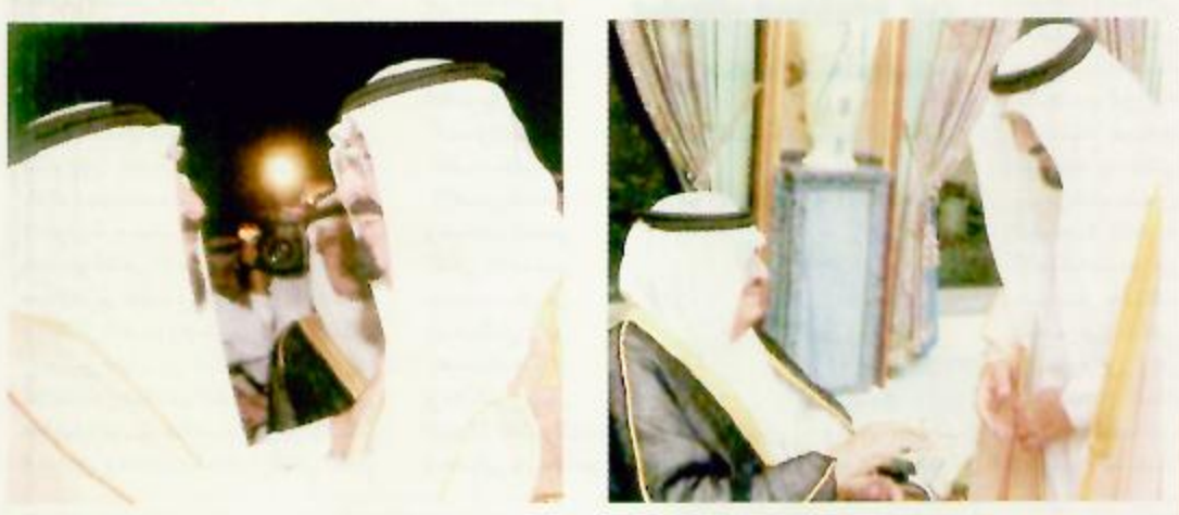
ولي العهد يعانق في مطار الملك عبدالعزيز بجدة