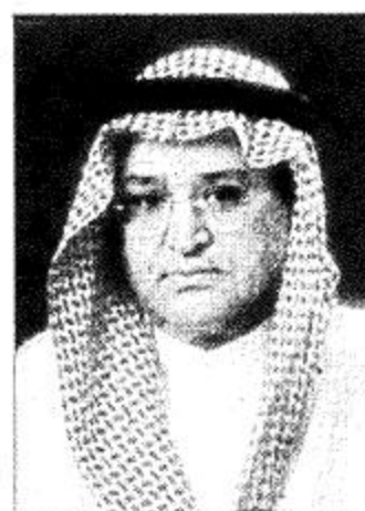
د. يمان يمان

نوه معالي وزير التجارة والصناعة الدكتور هاشم بن عبدالله يماني بما أعلته صاحب السمو الملكي الأمير عبدالله بن عبدالعزيز ولي العهد نائب رئيس مجلس الوزراء لوكالة الأنباء السعودية حول تخصيص مبلغ ٤ مليارات ريال من فائض الميزانية لشراء سلع تموينية.