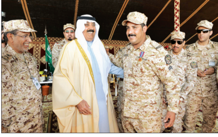
وزير الحرس الوطني يكرم أفراد الكتيبة المدفعية في عاصمة الحزم

وأوضح سمو الأمير متعب آل نهيان في الوقت الحاضر لإيجاد وحدات عسكرية ثابتة ودائمة في الحد الجنوبي، وأننا تحت أي أمر يأمر به سيدي خادم الحرمين الشريفين -حفظه الله- وأي مهمة أو عمل فنحن تحت السمع والطاعة وجاهزون لتنفيذ الأوامر.