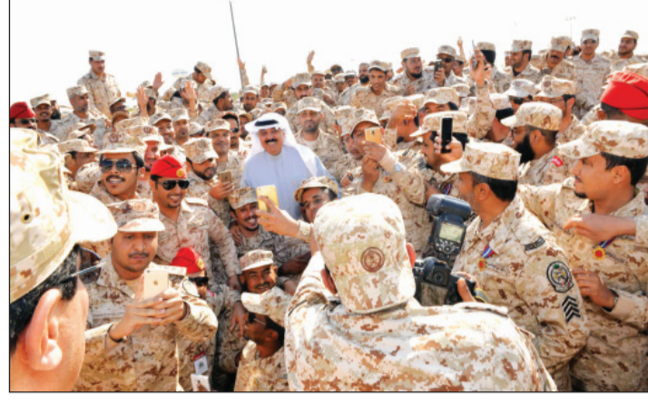
متعب بن عبدالله في لقطة مع أفراد كتيبة المدفعية العائدين للأحساء

الروح المعنوية التي ظهر بها أبناؤنا، الذين قالوا اليوم لنجران رجعتنا، ونحن مستعدون لأي مهمة نقوم بها، وهذا إن دل على شيء فإنما يدل على قوة إيمانهم بالله جميعاً أن الروح المعنوية للجنود العائدين من الحد