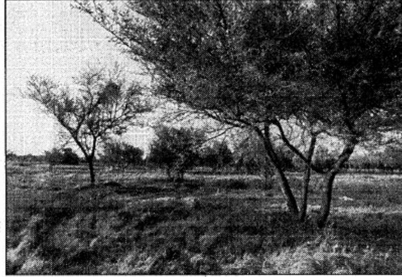
تقليم الاشجار ونهبة النواع للمتزهين