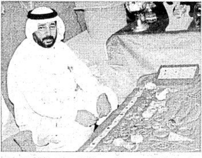
ذات التصاميم المختلفة سواء التراثية أو الرسمية أو اليومية الحديثة حتى أن حوالي ١٠-١٥٪ من المنتجات الذهبية تصدر الآن للأسواق العربية والعالمية.

الذهب الرائدة والتي تهدف لترويج وتطوير استثمارات معدن الذهب الثمين الذي تقوم هذه الشركات بالتشجيع ويشرف المجلس بحضوره العالمي على المهارات والموارد اللازمة لخلق ظروف سوقية ملائمة تسمح للمستثمرين والاستثمارين بالوصول للذهب وللمنتجات الذهبية.