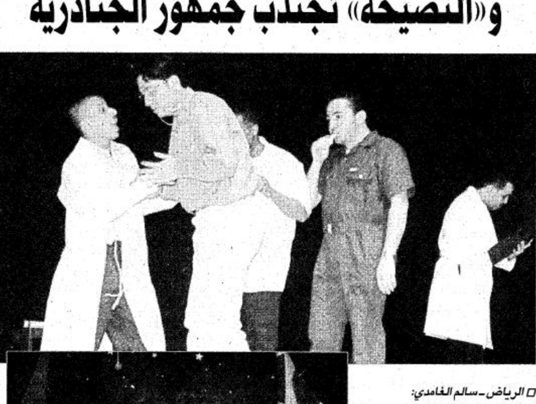
الرياض - سالم الغامدي:

قدم مكتب مسرحية منطقة مكة المكرمة مسرحية «الذات» ضمن مشاركة المكتب في النشاط المسرحي بمهرجان الجوادرية لهذا العام، والمسرحية من تأليف محمد سدي وإخراج إبراهيم شاه على وتحكي المسرحية صورة صراع بين مجموعة من الناس يقعون في مصحة عقلية لمعرفة ذواتهم وعلاقتهم بها.