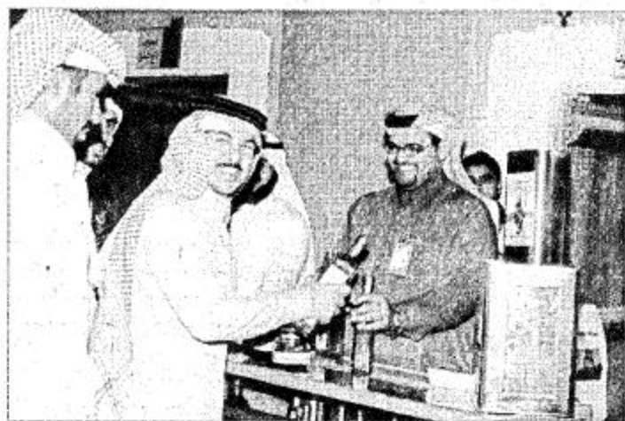
الجنادرية - جريد الجريد:

وزع جناح منظمة الجوف المشارك في مهرجان الجنادرية ١٨ العدد الأول من مجلة الرعاية الذي تشرف على إصداره حرم صاحب السمو الملكي الأمير فهد بن بدر بن عبدالعزيز أمير منطقة الجوف صاحبة السمو الملكي الأميرة سارة بنت عبدالله بن عبدالعزيز رئيسة المؤسسة الخيرية الوطنية للرعاية الصحية المنزلية بالجوف.