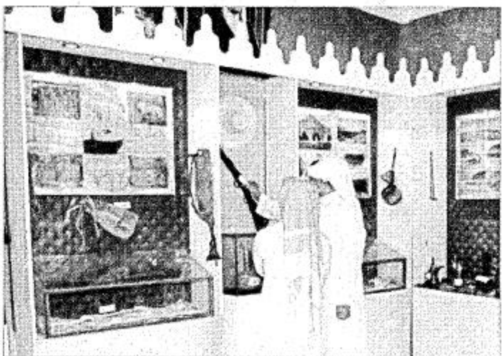
جانب من جناح منطقة نجران

حرصت إمارة منطقة نجران على تميز المشاركة لهذا العام وتمت الاستعدادات منذ وقت مبكر وجاءت مشاركة هذا العام لتضم بعض المشاركات الجديدة.