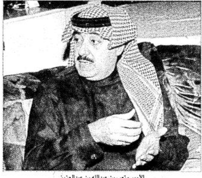
الأمير متعب بن عبدالله بن عبدالعزيز