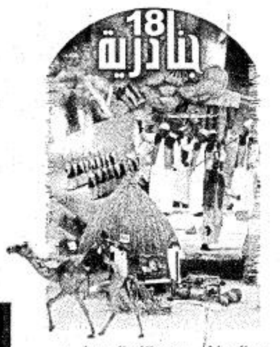
الرياض - عبدالله السمطي