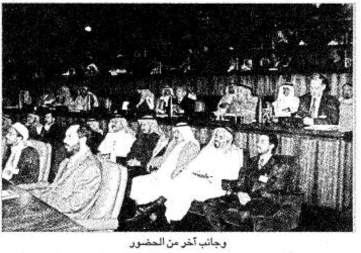
جانب آخر من الحضور