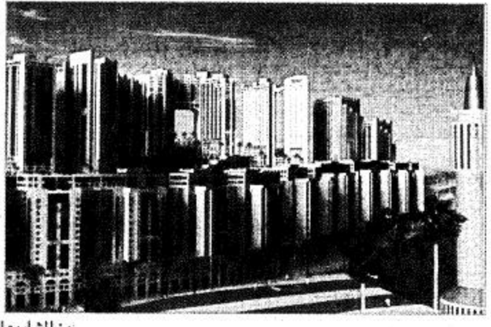
من المشاريع التطويرية في مكة