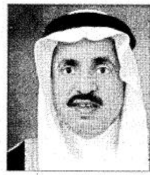
وقال مدير شرطة محافظة الخرمة ان هذه الثقة والترقية الجديدة ستكون بمشيئة الله دافعا لبذل المزيد من الجهد والعطاء في

وزير المعارف يشكر المدعج والزلفي - داود احمد الجميل: تلقى مدير تعليم البنات في محافظة الزلفي حمد بن محمد المدعج خطاب شكر وتقدير من معالي وزير المعارف الأستاذ الدكتور محمد بن أحمد الرشيد وذلك بنجاح حملة انتشار مجلة المعرفة في محافظة الزلفي واشتراك جميع مدارس تعليم البنات بهذه الحملة التي انطلقت خلال الفترة من ١٤٢٢/٧/٢١ هـ وحتى ١٤٢٣/٨/٢١ هـ