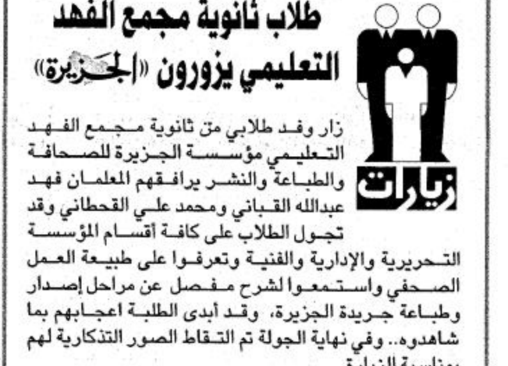
طلاب ثانوية مجمع الفهد

ترسل جميع التساؤلات والاستفسارات المتعلقة بالزوجة على العنوان التالي: جريدة الجزيرة - زاوية ركن الإرشاد - ص.ب (٣٥٤) الرياض (١١٤١١)، أو الهاتف المصور: ٤٨٧١٠٦٤ - ٤٨٧١٠٦٣ أو المراسلة على البريد الإلكتروني: alomari1420@yahoo.com.