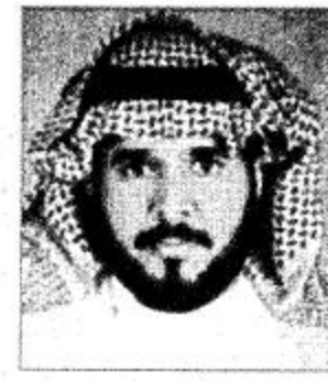
سبیل کل ما یخدم الدین والملک والوطن داعیاً لله عز وجل أن یدیم علینا نعمة الأمن والأمان والعزة والرفعة فی ظل عهدنا الزاهر للطر.