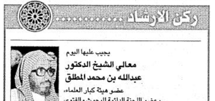
يحيى عليا اليوم معالي الشيخ الدكتور عبدالله بن محمد المطلق عضو هيئة كبار العلماء، وعضو اللجنة الدائمة للبحوث والفكرى

دايت وزارة المعارف على بذل الكثير من الجهود في سبيل راحة المعلم وتهيئة الجو الملائم لكي يعطي الكثير في سبيل خدمة التربية والتعليم ولكن ما يحدث في الميدان جعل الكثير من المعلمين يبذلون استحياءهم الشديد لما يحدث من إدارات التعليم في مختلف مناطق المملكة وهذا الاستحياء يرجع إلى تلك العقوبات التي تقدم عليها تلك الإدارات عندما يرتكب بعض الإداريين من مدير أو وكيل أو مرشد طلابي وغيرهم بعض الأخطاء التي توجب العقوبة فتقوم الإدارة بإصدار قرارها بتحويل ذلك الإداري إلى معلم وكان مهنة التدريس أصبحت مهنة للعقاب متناسبة بذلك القرار مشاعر المعلمين الكادحين في الميدان وكان تلك الإدارة لم تجد ما تعاقب به ذلك المدير أو