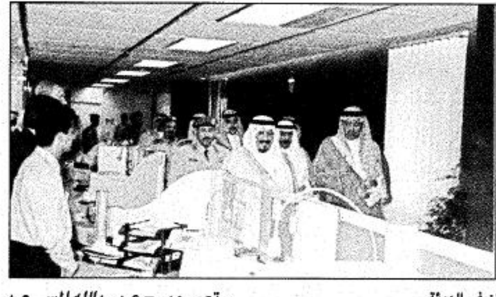
جولة الأمير سلطان في الهيئة

ويتوجهات من صاحب السمو الملكي الأمير سلطان بن عبدالعزيز النائب الثاني لرئيس مجلس الوزراء وزير الدفاع والطيران والمفتش العام ان تستقطب العديد من الكفاءات الوطنية وان تشرع في مشروع الخطة الوطنية مبيناً ان هذا المشروع الضخم بدأ بإنشاء قاعدة المعلومات التي تم التخطيط لها بصورة مدروسة لتخدم الاهداف التي سوف تسهم بإنارة الله في نمو وتطوير السياحة الوطنية على النحو المأمول.