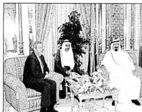
سمو ولي العهد يستقبل رئيس شركة اكسون موبيل

استقبل صاحب السمو الملكي الامير عبدالله بن عبدالعزيز ولي العهد ونائب رئيس مجلس الوزراء ورئيس الحرس الوطني في قصر سموه بالرياض مساء امس رئيس شركة اكسون موبيل العالمية لي ريموند وحضر الاستقبال صاحب السمو الملكي الامير سعود الفيصل وزير الخارجية وصاحب السمو الملكي الفريق اول ركن متح بن عبدالله بن عبدالعزيز نائب رئيس الحرس الوطني المساعد للشؤون العسكرية وصاحب السمو الملكي الامير عبدالعزيز بن عبدالله بن عبدالعزيز المستشار بديوان سمو ولي العهد ومعالي وزير البترول والثروة المعدنية المهندس علي النعيمي ورئيس فرع شركة اكسون موبيل بالملكة دان نلتون.