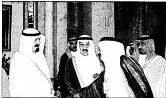
الرياض - واس