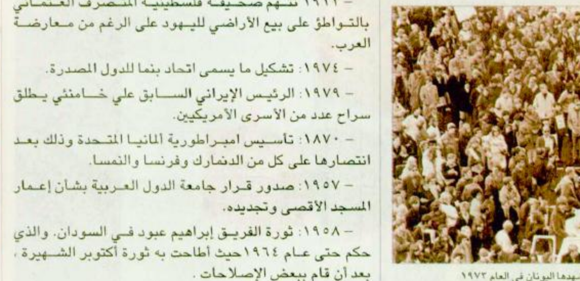
جانب من أكبر مظاهرات تشهدها اليونان في العام ١٩٧٣

في مثل هذا اليوم من عام ١٩٧٣ قام العديد من الطلاب في الجامعات التقنية اليونانية بالإضافة إلى جماعات من العمال وأصحاب الحرف بتنظيم ثورة ضد النظام العسكري الحاكم آنذاك، على إثر ذلك قامت السلطات اليونانية بفتح النار على المتظاهرين في أكبر مظاهرة تشهدها اليونان في ذلك الوقت، وكانت المظاهرات قد انطلقت من أمام مبنى السفارة الأمريكية باليونان احتجاجاً على تدعيم الولايات المتحدة ومساندتها للحكومة اليونانية التي شكلت في عام ١٩٦٧، والتي كانت تتبع النظام العسكري في حكمها للبلاد. كما استهدفت المظاهرات السفارة الأمريكية بعينها بسبب ما قامت به الولايات المتحدة من أعمال عسكرية في أفغانستان.