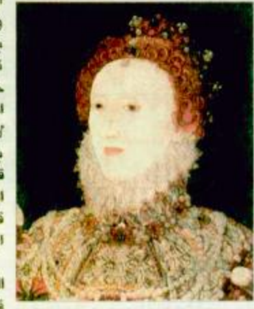
الملكة إليزابيث تيودور

في مثل هذا اليوم من عام ١٥٥٨ توجت الملكة إليزابيث تيودور ملكة على إنجلترا وهي في الخامسة والعشرين من عمرها، وقد ورثت حكم البلاد وهي مثقلة بالعديد من المشاكل الاجتماعية والاقتصادية، فقد قام أبوها بتبديد ثروات البلاد في عهده على الحروب الخارجية، كما تم استنزاف إنجلترا في عهد الملكة ماري الدموية في الحروب الدينية التي نشبت بين البروتستانت والكاثوليك. وقد كانت الملكة إليزابيث أعظم الملكات في تاريخ إنجلترا، فقد اعتلت عرش بريطانيا منذ عام ١٥٥٨ وحتى وفاتها عام ١٦٠٣، وفي أثناء حكمها استطاعت أن تعطي صورة قوية لحكم المرأة وللكبرياء القومي، كما قامت بتقوية صورتها كمملكة من خلال تحديث وتجميل بلادها ومن خلال السياسات الصلبة التي انتهجتها ودفع كل الأمة لتبنيها، وفي خلال عهدها الذي بلغ ٤٥ عاماً جعلت من إنجلترا قوة عالمية ومركزاً للإنجازات الثقافية والفنية، كما أصبح قصرها رمزاً لقمة الثقافة الإنجليزية. وقد ولدت الملكة إليزابيث في السابع من سبتمبر عام ١٥٣٣ في قلعة جرينويش بلندن، وقد قام أبوها الملك هنري الثامن بتطويق زواجه الأولي كاثريين من أوريجون ليتزوج أمها آن بولين، وقد كان ذلك هنري الثامن يريد إنجاب ابن ذك ليخلفه في حكمه، ولكنه أصيب بجنونٍ أمل وغضب غضباً شديداً عندما ولدت زوجته ابنة أخرى وهي إليزابيث، وقد عانى الشعب الإنجليزي كثيراً في البداية لتقل أمرة كملكة للبلاد، فلم يسبق أن استطاعت امرأة أن تحكم البلاد بمفردها.