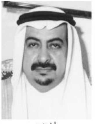
فهد سالم السبيتي

عبر معالي محافظ الطائف فهد بن عبدالعزيز بن معمر عن عظيم سعاده بصور الميزانية العامة للدولة عن هذا العام ووصفها بأنها تصب في خدمة المواطن ورعايته وتوفر في صلب العمل للأبناء. وقال معاليه في تصريح خص به (الجزيرة): لقد حملت الميزانية الخيرة ميزانية الأمل للعديد من التضامين الهامة منها دعم صندوق التنمية العقارية بمبالغ مالية تعجل وتمكن المواطن من الاستفادة مما يقدمه من خدمة بالإضافة إلى دعم بنك التسليف كما حملت الميزانية زيادة الدعم للقطاع التعليمي والصحي ودعم كافة مشاريعه وزيادة التوسع والتطوير.