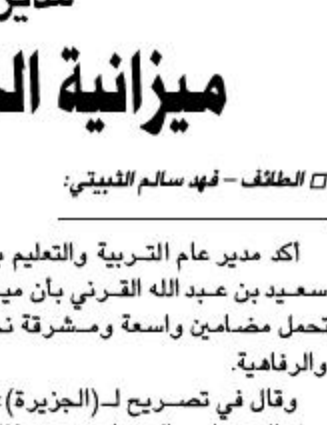
د. خالد العيبان

دكتور خالد العيبان وكيل وزارة الصحة للتخطيط والتطوير أن ميزانية الخير لهذا العام بشري لكافة المواطنين، لما حملته من جوانب كبيرة وكثيرة برافاهية المواطن في هذا الوطن المعظم من قياداته، التي ركزت على إتمام العديد من الجوانب التي تمس المواطن وحياته اليومية خاصة الصحية، والتي تأتي من استمرارية أفكار وتوجهات ولاه الأسس حفظهم الله - ليته واستمرارية البنية التحتية الأساسية التي عمل بها وما سيعمل بها لاحقاً، مما يوثر ما يحتاجه المواطن في وطن الخير والمعطاء.. مشيراً د. العيبان إلى أهمية متابعة تفعيل وترجمة ما يراه ولاة الأمر - حفظهم الله - في ميزانية الخير لهذا الوطن وابتدائه.. امتتاني عظيم وكبير على هذه النعمة التي يحظى بها كل مواطن في هذا الوطن الغالي علينا جميعاً.. ورفع د. العيبان التهنية للقيادة الرشيدة ثم لعالي وزير الصحة وللمواطنين.