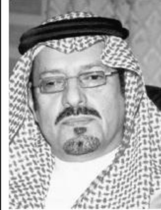
الأمير سعود بن عبدالمحسن

الجزيرة: إن كل المؤشرات تدل على الحماس والاهتمام بالوطن والمواطن وسيطور الوطن، مبدئياً سموه إن اشتمل الإيرادات على ٢٨٠ ملياراً والتفقيات على ٢٨٠ ملياراً يعني توازناً وحرصاً على التنمية واستمرار عجلة التطور في بلادنا، مؤكداً سموه أن تخصيص سبعين ملياراً لقطاع التعليم وسبعة وعشرين ملياراً للقطاع الصحي هو انعكاس حقيقي لى حرص سموه على إنعاشها وتطويرها للقطاعات التعليمية والصحية واهتمامها بالمشاريع التي لها مساس براحة المواطن سواء البلدية منها والاجتماعية أو الطرق وبعض مشروعات البنية الأساسية.