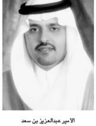
الأمير عبدالعزيز بن سعد

حائل - عبدالعزيز العبيدة: أكد صاحب السمو الملكي الأمير عبدالعزيز بن سعد بن عبدالعزيز نائب أمير منطقة حائل أن النظرة الثاقبة لحكومة خادم الحرمين الشريفين وسمو ولي عهده الأمين وسمو النائب الثاني قد تجلت في موازنة هذا العام وما اشتملت عليه من أرقام ومشاريع خير لكافة المناطق، وقال سموه في تصريح لـ(الجزيرة) أن الزيادة عن الميزانية السابقة وحجم التفقيات والتي جاءت متساوية مع الإيرادات بما يساوي ٢٨٠ مليار ريال ودعم كافة المشاريع التي لها مساس وانعكاس على رفاهية المواطن وجعلنا نطمئن على مستقبل وطننا.