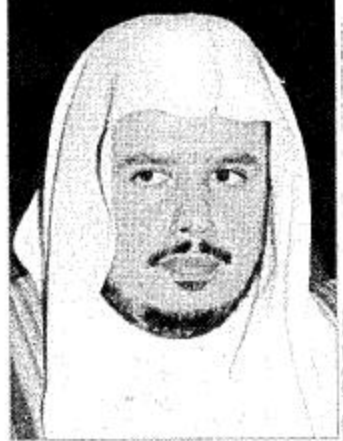
وزير العدل المختلفة لها، ورسد العقبات التي تعترض تحقيقها وإيجاد الحلول لها، وكذلك رفع الوعي الثقافي بحقوق الإنسان.

الحقوق. وأوضح الشيخ عبدالله آل الشيخ أن انعقاد المؤتمر بالملكة في هذه المرحلة يؤكد اهتمامها بقضايا حقوق الإنسان ومدى التزامها بالحفاظ عليها في ظل الظروف الدولية الراهنة التي تتعرض للإنسانية بسببها إلى مخاطر عديدة في مختلف أنحاء العالم.