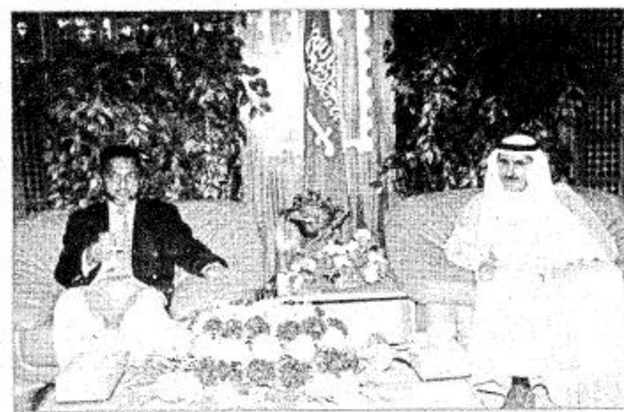
جانب من الاستقبال