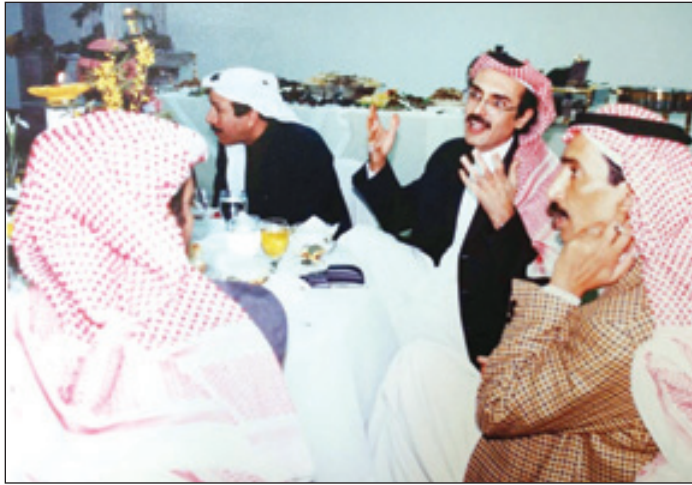
الفقيد مع الشاعر الأمير بدر بن عبدالمحسن