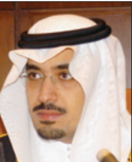
الأمير الشاعر نواف بن فيصل