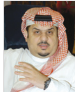
الأمير الشاعر عبدالرحمن بن مساعد