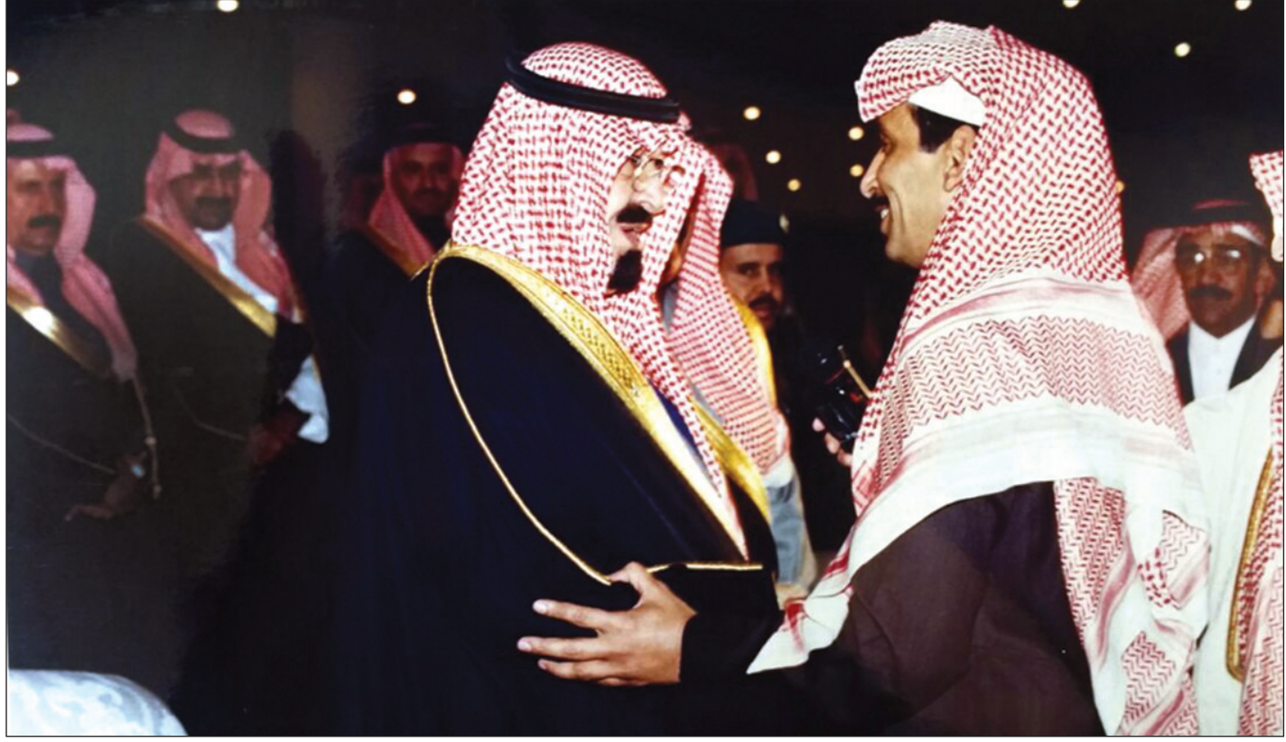
أثناء تشرّفه بالسلام على الملك عبدالله بن عبدالعزيز - رحمهما الله -

عبر عن فقده صاحب السمو الملكي الأمير متعب بن عبدالله وزير الحرس الوطني بقوله: «كلنا مفجعون بوفاة الوفي مساعد الرشيدى وكلنا نعزى به وقد تألمت كثيرا عندما زرتة وهو على فراش المرض فهو أحد أبناء هذا الوطن المعطاء وأحد شعراء الحرس الوطني الذين يشار لهم بالبنان وأبناؤه هم أبنائي عليه رحمة الله».