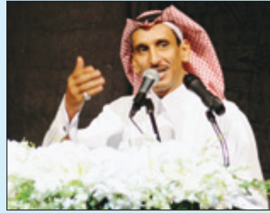
الراحل في إحدى أمسياته الشعرية

بحزن عميق، وألم شديد ودعت الأوساط الأدبية الشاعر العميد مساعد الرشيدى المولود في مدينة الدمام بعد عمر ناهز (55) عاماً، والذي امتد عطاءه الشعري لأكثر من ثلاثة عقود، كان من خالخاله رفيقاً وفي الجرف وللجمال والإبداع: أنا الشعر عندي مثل الإنسان كائن حي رفيق وله حق الوفا يا موثقته رفيق لي لست أعين الشدايد لي شلح كنهه اللي نازع من شواهيقه وكان الراحل لديه قدرة فائقة على اختيار المفردة الجميلة والنارة، والتي استطاع أن يوظفها بشكل لائق فتكون القوافي أكثر جمالاً وأناقة، ومتوشحة بالإبداع والتميز، وكلما طال بها الزمان كلما أصبحت متجددة، وأكثر متعة، واستمتاع لدى المتلقي: تخوفني مشاوير الطريق المظلم المهجور واليا ميني تكركت قلت طولي يا مشاويري عزاي إنك رجائي العبلول كل الدروب عثور وصلت أو ما وصلت أعفلمانته منتظر غيري ونظراً لما وهبه الله من موهبة قوية فقد أشاد بإبداعه الأبدي العبد من النقاد والشعراء والأدباء المعروفين في الأوساط الأدبية. كما أنها تتميز بالجزالة والحساس، وكذلك الذود عن الأرض بكل بسالة وشجاعة: سلام من مهد النبوه والسلام وأرض العروبه والعرب وإعراها دار ثراها كل ماحسن الغمام يلمس جبينه فاض سيل أشعابه وكثير ما نجد في أشعاره - رحمه الله- ذكر العطر،