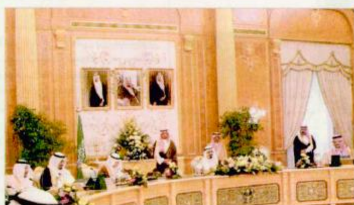
اجتماع مجلس الوزراء برئاسة سمو ولي العهد

ثانياً: بعد الإطلاع على ما رفعه معالي وزير التعليم العالي بشأن طلب معاليه تفويضه بالتباحث مع الجانب الكوري لإعداد مشروع