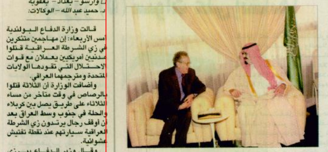
ولي العهد يستقبل معرث الأمين العام للأمم المتحدة في العراق - واس

ومن جانب آخر أعلنت الشرطة البريطانية أن أحد البريطانيين الخمسة المنتمين للثلاثين أفرجت عنهم السلطات الأمريكية من قاعدة غوانتانامو في كوبا وعادوا إلى بريطانيا. أطلق سراحه مساء الثلاثاء بعد استجواب جرى معه لبضع ساعات.