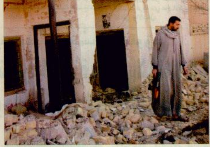
مكتب فيلق بدر بعد الانفجار الذي هز واجهته

أكد الرئيس الدكتور عبدالله بن صالح العبيد أن إنشاء الجمعية جاء مواكبا للمتغيرات والأحداث وتلبية لحاجات محلية وتطلعات خارجية. وقال في حديث لـ(الجزيرة): إن ذلك يعد جزءاً من التطور الذي تشهده المملكة في جميع الجوانب المختلفة وأضاف إن الجمعية ستركز على حقوق المواطن في مراقبة ما يتعلق بحقوقه ومتابعته كما أقرها الشرع وكما تنظمها الأنظمة المرعية وحمايته من المخالفات أو التجاوزات التي قد ترتكب بحق.