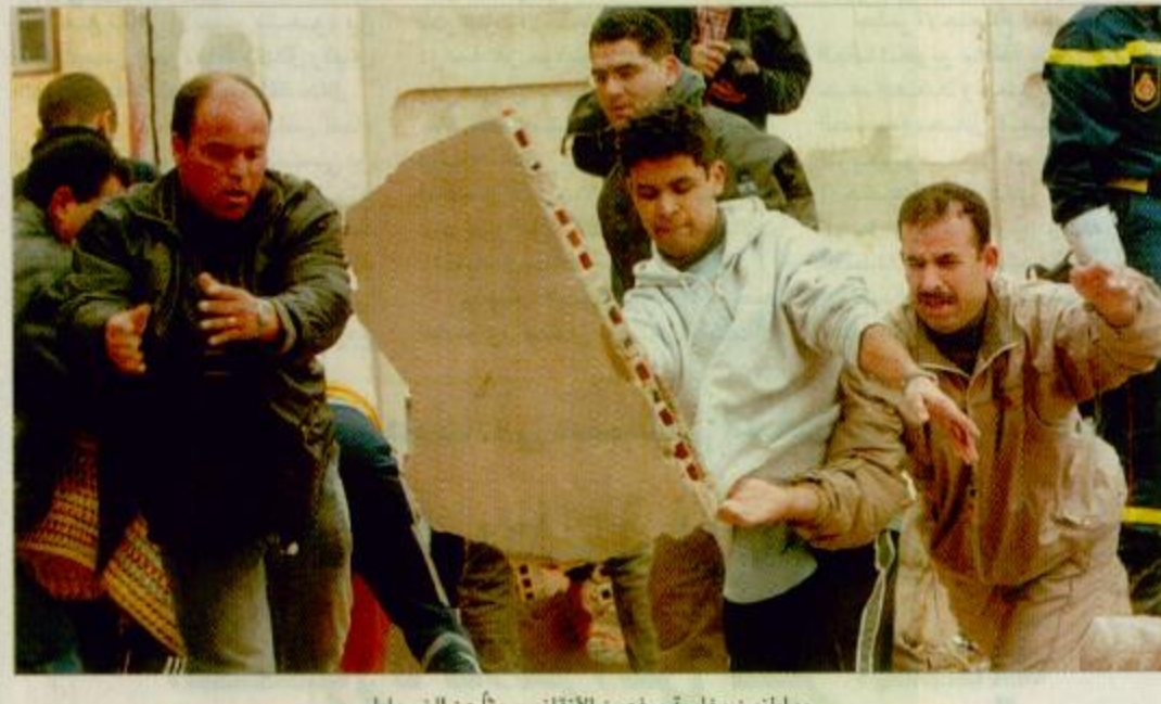
موظفون مغاربة يرفعون الأتقاض بحثاً عن الضحايا

الحسيمة (المغرب) - الوكالات: قبل يومين واضطر سكانها إلى المبيت في العراء تحسباً لهزات ارتدادية. وقد فضل القسم الأكبر من سكان المدينة والمنطقة المحيطة بها المغربة التي ضربها زلزال مدمر بدأت المساعدات الأجنبية الأولى بالوصول إلى مدينة الحسيمة المغربية التي ضربها زلزال مدمر