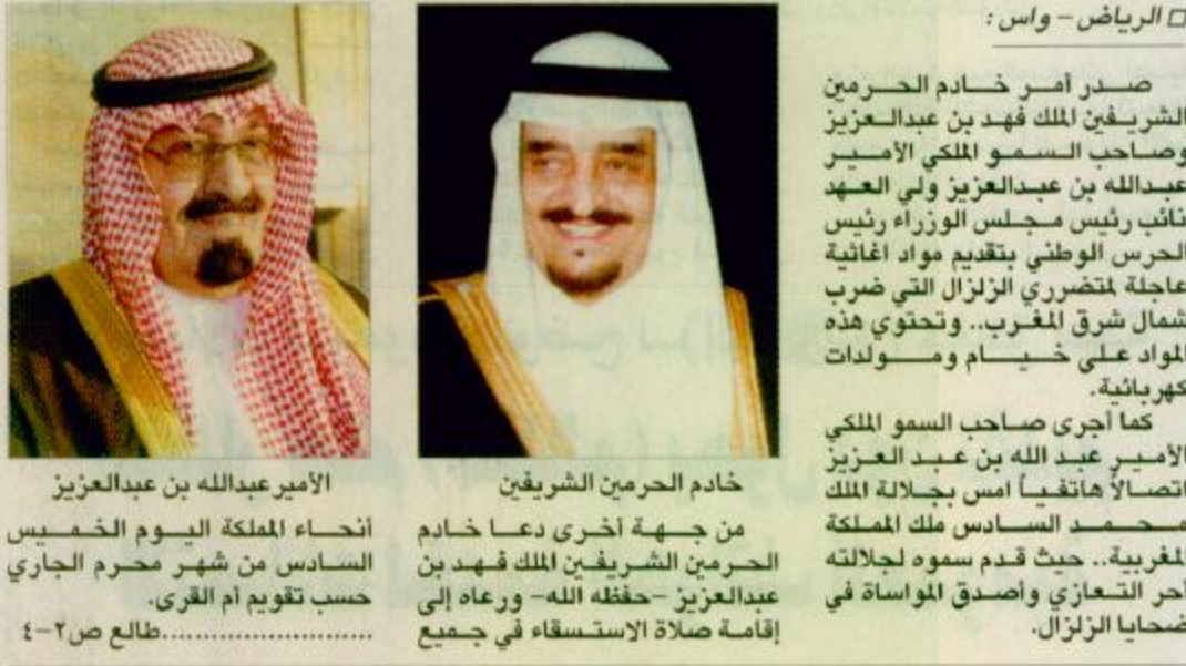
الأمير عبدالله بن عبدالعزيز خادم الحرمين الشريفين من جهة أخرى دعا خادم الحرمين الشريفين الملك فهد بن عبدالعزيز إلى إقامة صلاة الاستسقاء في جميع أنحاء المملكة اليوم الخميس السادس من شهر محرم الجاري حسب تقويم أم القرى. طالع ص ٢٠