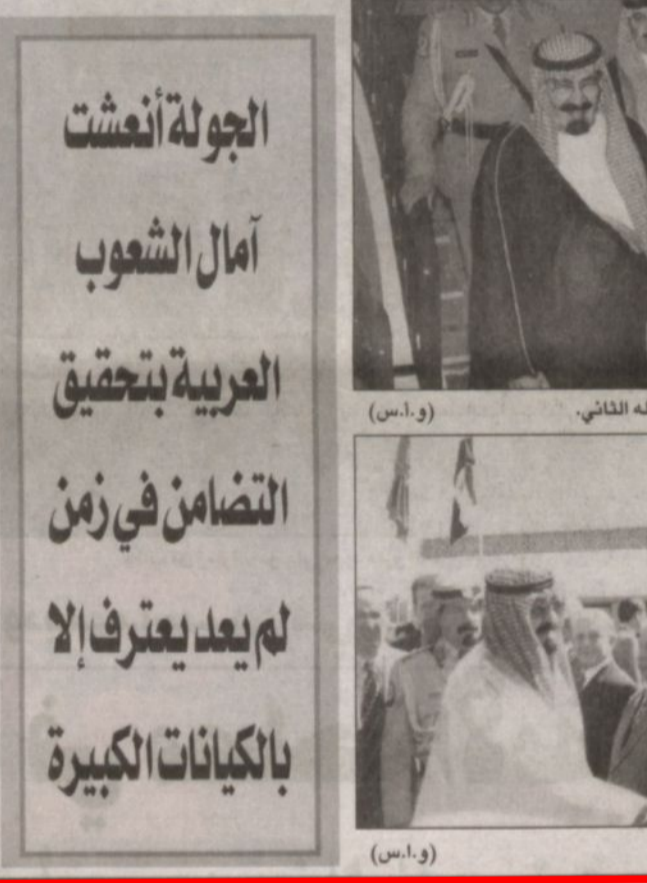
سمو ولي العهد وحديث باسم مع الملك عبدالله الثاني. (و.أ.س)