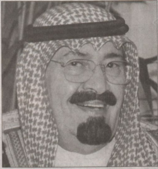
صورة بنتها وكالة رويترز وقالت في تعليقها «صاحب السمو الملكي الأمير عبدالله ميمسماً خلال لقائه الملك مع العاهل الأردني الملك عبدالله في القصر الملكي بعمان». (خاصة بـ«الرياض» من رويترز)