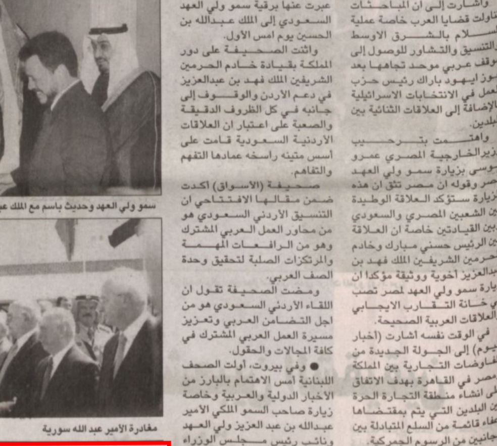
مغادرة الأمير عبد الله سورياً (و.أ.س)