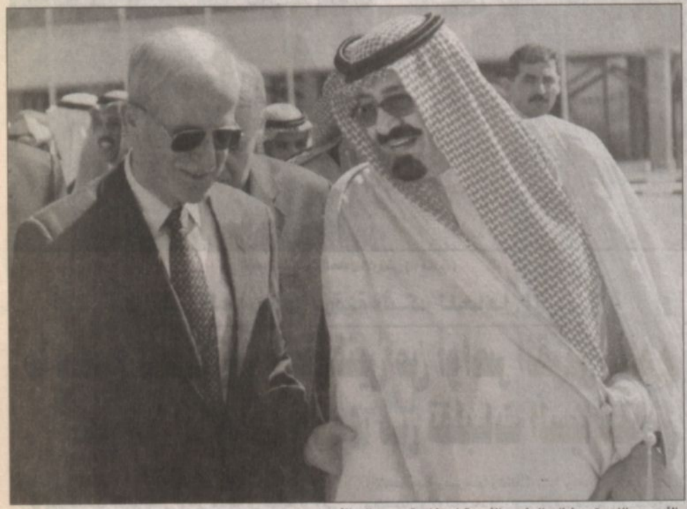
الأمير عبدالله يتحدث إلى سمو ولي العهد خلال مباحثاتها في دمشق.