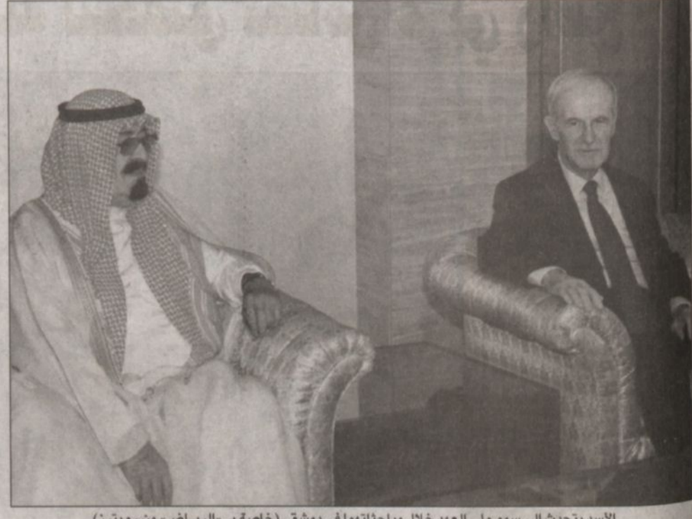
الأسد يتحدث إلى سمو ولي العهد خلال مباحثاتها في دمشق.

ولن نقبل باجتماع الحلول او انصافها ولو وقع عليها كل العالم فاما حقوقنا كاملة وعلى رأسها قدسنا الشريف ولا فإن السلام سيبقى في رحم الغيب... والواقع ان هذه المواقف المشرفة ليست جديدة ولا غريبة على المملكة العربية السعودية التي اتسمت بسياستها دائماً بالهدوء والوسطية... حيث يقول سموه ان المملكة ليست وسيطاً في عملية السلام بل هي شريك فيها فنحن من شجعنا العربية يوماً وتوجهنا وتاريخاً وقبل ذلك عقيدة هي الأمانة في أعناقنا... ويقول ان المملكة ثابتة في مواقفها مع الحل العادل الشامل الذي يحفظ حقوق امتنا العربية المشروعة في أرضها وانسانها