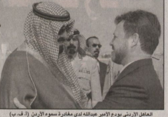
العاهل الأردني يودع الأمير عبدالله لدى مغادرته سموه الأردن