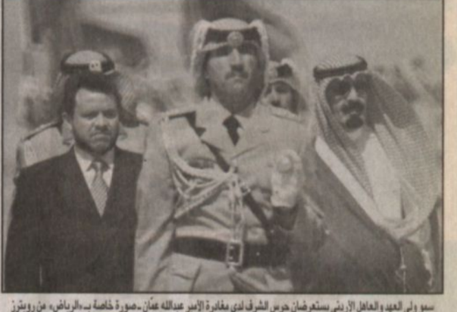
سمو ولي العهد والعاهل الأردني يستعرضان حرس الشرف لدى مغادرة الأمير عبدالله عمان