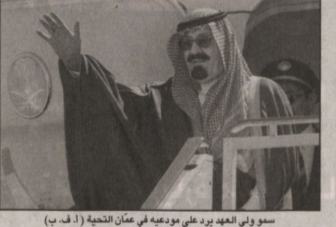
سمو ولي العهد يرد على مودعيه في عمان التحية