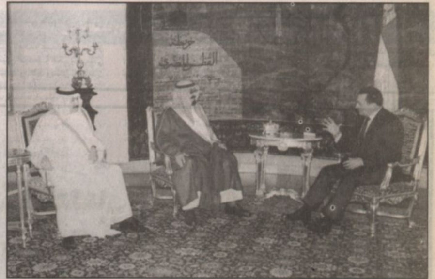
لقاء الرئيس مبارك وسمو ولي العهد في القاهرة