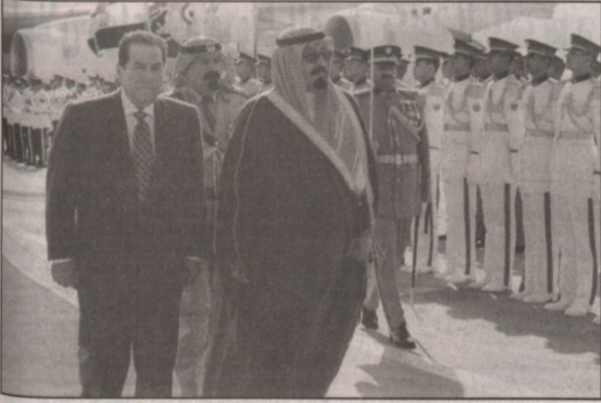
سموه يستعرض حرس الشرف - الصورة خاصة بـ «الرياض» من رويترز.