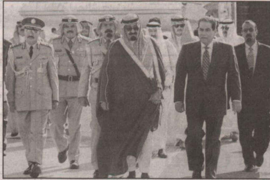
الأمير عبدالله ولي وصوله مطار القاهرة واستقبال رئيس الوزراء المصري لسموه على أرض المطار