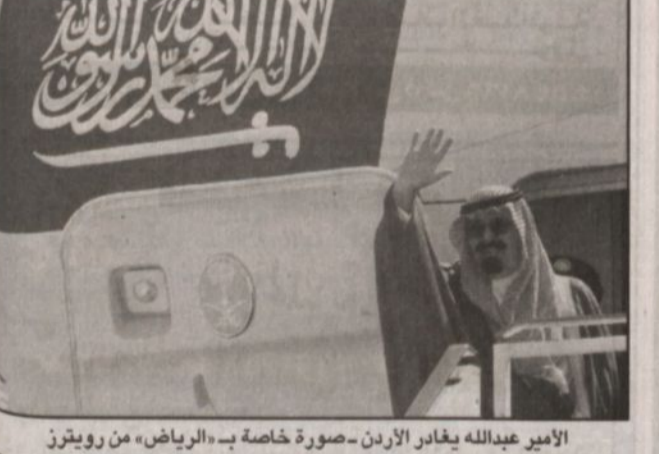
الأمير عبدالله يغادر الأردن