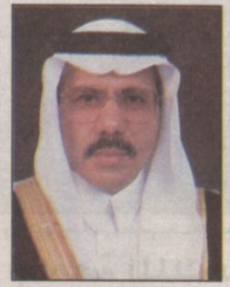
د. علي الجهني

كتب - مندوب «الرياض»: في توضيح لـ «الرياض» عن ما كثر الحديث حوله، عن تكاليف الحصول على الأرقام المميزة، قال معالي وزير البرق والهاتف ورئيس مجلس إدارة شركة الاتصالات السعودية علي بن طلال الجهني: يكثّر الحديث هذه الأيام عن الأسعار المرتفعة التي تتطلبها شركة الاتصالات السعودية، من الذين يرغبون أن تكون أرقام هواتفهم، من الأرقام التي يسمونها «مميزة»، وهي في الحقيقة ليس فيها ما يميزها عن بقية الأرقام، شيء من حيث مستوى الخدمة وجودتها.