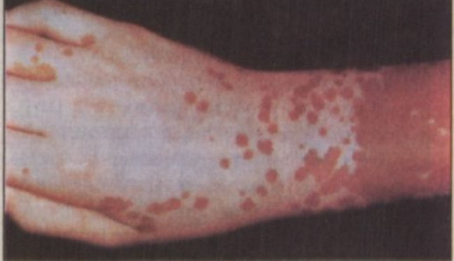
يد مصابة بالبهاق

مكة المكرمة - خالد الجمعي: قام معهد خادم الحرمين الشريفين لأبحاث الحج بإجراء دراسة من أهم الطفيليات المسببة لحالات الاسهال الحاد في موسم حج ١٤١٩. صرح بذلك الدكتور زامل جميل عطار الباحث الرئيسي للدراسة وقال ان هدف الدراسة هو البحث عن الطفيليات في اجسام الأطفال وخاصة ذوي نقص المناعة الذين يعانون من خلل في وظائف اجسامهم ويعانون أيضاً من نقص في التغذية. وأوضح الدكتور عطار ان الاسهال هو احد أهم المؤثرات أو الأعراض للعديد من الأمراض الفيروسية والبكتيرية والطفيلية وعادة ما تنتشر جود وزارة الصحة أثناء موسم الحج في الكشف عن وجود الكوليرا والتسمم الغذائي مسببات للاسهال وذلك بناء على توصيات منظمة الصحة العالمية وكذلك مركز التحكم في العدوى على اعتبار ان هذين