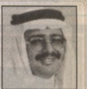
بِقلم: عدنان إبراهيم المحيسن