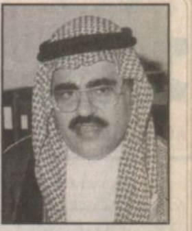
بِقلم: د. جاسم بن محمد الأنصاري مرحباً بك

تفتتح مدينة الجبيل الصناعية ذراعها يوم لانتقال صاحب السمو الملكي الأمير عبدالله بن عبدالعزيز آل سعود ولي العهد ونائب رئيس مجلس الوزراء ورئيس الحرس الوطني حيث يندش سموه الكريم مشروعات خير وبركة ونماء تصاف إلى منجزات الوطن كلبنة جديدة تؤكّد أن اقتصاد بلادنا ثابت الأسس والراسخ تعتمد عليه بعد الله نهضة هذه البلاد المباركة برعاية مولاي خادم الحرمين الشريفين الملك فهد بن عبدالعزيز - يحفظه الله - وحرص واهتمام حكومته الرشيدة الدائم على كل ما يخدم ويسعد الوطن والمواطن.