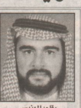
بِقلم: المهندس ناصر بن راشد الغامدي

إن السعادة تغمرنا كثيراً في مدينة الجبيل الصناعية وبالخاص نحن منسوبي الهيئة الملكية للجبيل وينبع وتشرف كثيراً بهذه الرعاية الكريمة من قبل صاحب السمو الملكي الأمير عبدالله بن عبدالعزيز ولي العهد ونائب رئيس مجلس الوزراء ورئيس الحرس الوطني ولنا الفخر أن نطلع سموه الكريم على ما أنجزناه وما تحققت لهذه