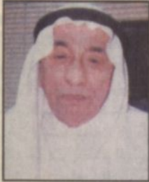
بقلم / سعود بن عبدالعزيز الشافعي

تعيش الشرقية والأحساء باكملها في أفراح متتالية فقبل أيام كان الفرح بالعيد الكبير واليوم الفرح بقدم سمو ولي العهد في زيارته الميمونة حيث تتشرف الأحساء برعايته حفظه الله للعديد من المشاريع التنموية والتي هي خير برهان على مدى التلاحم والترابط بين أبناء هذا الوطن المعطاء مع قيادته الحكيمة كما تدل هذه الزيارة على الاهتمام الدائم والشامل من القادة بكل ما ينفع أبناء هذا البلد وعلى رأسهم قائد السيرة مولاي خادم الحرمين الشريفين وأصالة عن نفسي وبنيابة عن أسرة الشافعي بالشرقية نرحب بسموه الكريم وصحبه الكرام أجمل ترحيب.