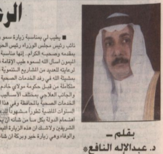
بقلم - د. عبدالله النافع

بطلب لي بمناسبة زيارة سمو ولي العهد صاحب السمو الملكي الأمير عبدالعزيز آل سعود نائب رئيس مجلس الوزراء رئيس الحرس الوطني لحافظة الأحساء أن أمير من مشاعر الحب والولاء والفرحة بمقدمه وصحبه الكرام. إنها مناسبة تاريخية وعظيمة غمرت الأحساء بالفرح والسرور استهياً بمقدمه الميمون لسمو الله لسمو طيب الإقامة في الأحساء الحبية والوفية. كما تقدم لسمو حفظه الله بالشكر الجزيل لراعيته للعديد من المشاريع التنموية في المحافظة ومن بينها مشروع مستشفى الأحساء الذي سوف يساهم بمشقة الله في رفد الخدمات الصحية وتعزيزها. إن تحظى محافظة الأحساء وله الحمد بعناية كبيرة ورعاية متكاملة من قبل حكومة مولاي خادم الحرمين الشريفين يحفظه الله وحملت هذه الخدمات الجانب الوقائي والجانب العلاجي مختلف الأساليب وغير كافة الوسائل الكفيلة بالإسهام في بناء صحة المواطن. والحق أن الخدمات الصحية بالحافظة وفي هذا العهد الزاهر العهد التطور تنامت وتطورت عشرات المرات وحقت خلال السنوات الماضية تطوراً مشهوداً بدعم المستيرين من قيادتنا الحكيمة. وبهذا الزيارة الكريمة من سموه جسد اهتمام الدولة بكل ما من شأنه أن يتختم المواطن في ولائنا انطلاقاً من توجيهات مولاي خادم الحرمين الشريفين ولاشك أن هذه الزيارة الميمونة والتي تجمع القيادة بأفراد المجتمع تؤكد مدى التلاحم والحمية والوفاء وزيارة خير وبركة إن شاء الله سبحانه وحفظه وصحبه الكرام.