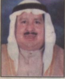
بقلم: علي حسين الخرس

يسرنا نحن مؤسسة الخرس التجارية بالمنطقة الشرقية أن يكون لنا شرف المساهمة بهذه الكلمة بمناسبة زيارة سيدي ولي العهد النائب الأول لرئيس مجلس الوزراء ورئيس الخرس الوطني لشهد افتتاح المشاريع التنموية الهامة للوطن والمواطن مما يجعل هذه المنطقة من أفضل المناطق صناعياً وزراعياً وسياحياً وصحياً وتعليمياً ووضع حجر الأساس لمشاريع كبرى وهامة والتي سوف يكون تأسيسها في ظل الدعم السخي من قائد مسيرتنا مولانا خادم الحرمين الشريفين وولي عهده الأمين والنائب الثاني وحكومته الرشيدة وأن زيارته لهذه المنطقة الأثر العظيم في قلوب المواطنين جميعاً سائلين الله أن يحفظ سموه وصحبه الكرام في حلهم وترحالهم وأن يوفق حكومتنا الرشيدة لما فيه الخير والتقدم والازدهار لمملكتنا الحبيبة وحيث إن مواطني هذه المنطقة يعيشون هذه الأيام في غمرة من السعادة والسرور بقدم سيدنا ولي العهد وصحبه الكرام لافتتاح المشاريع التي لها الأثر الكبير في تطور الحركة العمرانية والاجتماعية والمالية في المنطقة والتي بدورها تنعكس على مستوى المعيشة للفرد السعودي في جميع المجالات الحياتية وأن هذه المشاريع دائمة تحمل في طياتها كل سبل الخير والعطاء غير المحدود وهذا ليس بالغريب على سياسة حكومتنا الرشيدة في تطوير هذا الوطن والرفق بالفرد والمجتمع السعودي إلى أرقى المستويات العالية نسأل الله العلي العظيم أن يحفظ لنا قائد مسيرتنا مولانا خادم الحرمين الشريفين وولي عهده الأمين والنائب الثاني وحكومته الرشيدة إنه سميع مجيب.