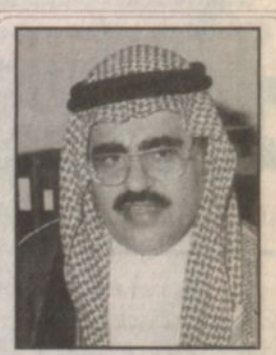
بقلم: د. جاسم بن محمد الأنصاري مرحباً بك

تمتاز مدينة الجبيل الصناعية باحتوائها على أنواع متعددة من الصناعات التي تتراوح بين المعدني الكيماوية والمجمعات البترولية والكيمياوية والصناعات التي تستخدم من منتجات الصناعات الكيماوية. وتنقسم هذه الصناعات إلى ثلاثة أنواع: الصناعات الأساسية، الصناعات التكميلية، والصناعات الكيماوية.