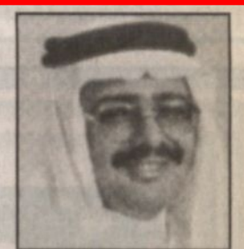
بقلم: عدنان إبراهيم الجبيل