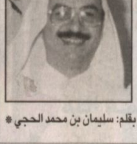
بقلم: سليمان بن محمد الحجبي