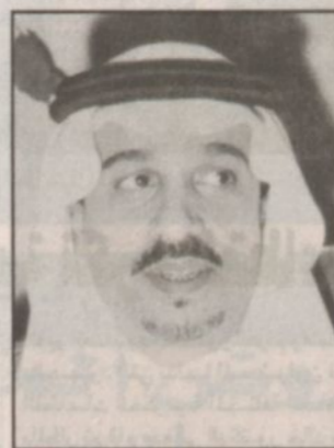
الأمير فيصل بن بندر

برقية شكر لسمو ولي العهد كما رفع سموه برقية تقدير وامتنان