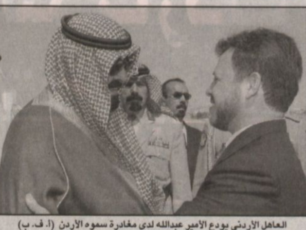
العاهل الأردني يودع الأمير عبدالله لدى مغادرته سموه الأردن