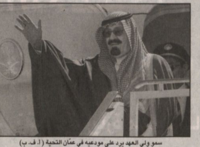
سمو ولي العهد يرد على مودعيه في عَمَن التحية