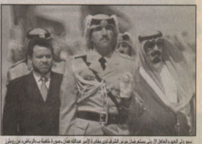
سمو ولي العهد والعاهل الأردني يستعرضان حرس الشرف لدى مغادرة الأمير عبدالله عَمَن.