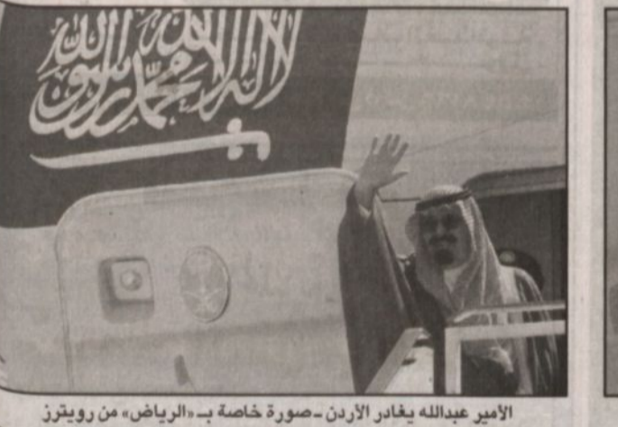
الأمير عبدالله يغادر الأردن