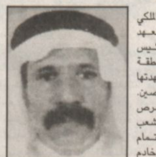
ب.قلم: د. عبدالعزیز بن عبداللطیف القرن

ان زيارة صاحب السمو الملكي الامير عبدالله بن عبدالعزيز ولي العهد ونائب رئيس مجلس الوزراء ورئيس الحرس الوطني - حفظه الله - للمنطقة الشرقية لهي امتداد للزيارات التي شهدتها هذه المنطقة من لالة الامر المخلصين.