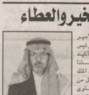
ب.قلم: د. سعد بن عبدالله البراك

تأتي زيارة صاحب السمو الملكي الامير عبدالله بن عبدالعزيز ولي العهد نائب رئيس مجلس الوزراء ورئيس الحرس الوطني لتأكيد وتوثيق العطاء المستمر من لدن حكومتنا الرشيدة بقيادة خادم الحرمين الشريفين الملك فهد بن عبدالعزيز حفظه الله ورعايه في كل من شأنه تنمية محافظة الاحساء ورفع مستوى الخدمات بها نحو الافضل انما زيارة الحب والخير والعطاء وانما ليسعد كافة المواطنين بالاحساء ان يروا سموه الكريم واضعا حجر الأساس لهذه المشاريع الحيوية الهامة. ولعل من أبرز هذه المشاريع واحمها مشروع ابدال مياه الشرب الحالية الى المحافظة لتسهم هذه المياه بإذن الله في حل مشكلة نقص المخزون المائي بالطبقات الحاملة ولكي تتوفر المياه الجوفية للأغراض الزراعية وبذا تظل واحة الاحساء قاعدة زراعية على مر العصور. كما ان وضع سموه الكريم لحجر الأساس لبعض المشاريع التابعة لشركة الاحساء للتنمية تعتبر لفحة كريمة ورعاية متواصلتة من لدن سموه لدفع القطاع الخاص الى المزيد من العطاء والتفاعل مع الخطط التنموية الطموحة التي رسمتها حكومتنا الرشيدة سدده الله الخيط وبارك لنا نهضتنا الشامخة.