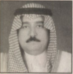
عبدالله بن عبدالعزيز

تسعد مدن المنطقة الشرقية بزيارة الكريمة لصاحب السمو الملكي الأمير عبدالله بن عبدالعزيز ولي العهد نائب رئيس مجلس الوزراء ورئيس الحرس الوطني وقد انتهجنا كثيرا بهذا المقدم المبارك ونعتمده بحق يومنا من أيامنا العزيزة