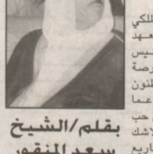
ب.قلم: الشيخ سعد المنقور

تشكل زيارة صاحب السمو الملكي الامير عبدالله بن عبدالعزيز ولي العهد نائب رئيس مجلس الوزراء ورئيس الحرس الوطني لحفاظة الاحساء فرصة مناسبة عظيمة يعبر فيها المواطنين كبيرهم وصغيرهم لسموه الكريم عما يكونونه في قلوبهم ومشاعرهم من حب وتقدير لسموه وقيادتنا الحكيمة ولاشك ان رعاية سموه حفظه الله للمشاريع التنموية المختلفة في المحافظة انما تعبر عن عظيم تقديره لكل ما يخدم الوطن والمواطن