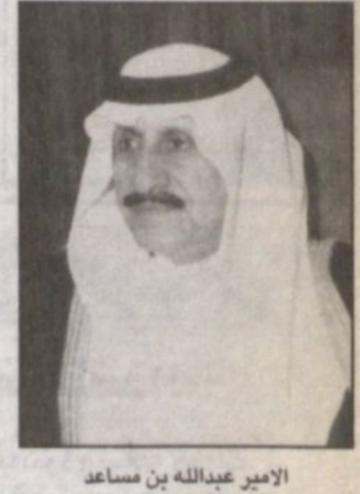
الأمير عبدالله بن مساعد

الرياض - و.أ.س: رأس صاحب السمو الملكي الأمير عبدالله بن عبدالعزيز ولي العهد ونائب رئيس مجلس الوزراء ورئيس الحرس الوطني الجلسة التي عقدها مجلس الوزراء بعد ظهر أمس (الاثنين) في قصر اليمامة بمدينة الرياض. وتحدث سمو ولي العهد خلال الجلسة عن ثوابت سياسة المملكة العربية السعودية بقيادة خادم الحرمين الشريفين الملك فهد بن عبدالعزيز حفظه الله تجاه مختلف القضايا وسعيها المستمر في مساندة الأشقاء ولمّ الشمل العربي وتوحيد كلمته واستثمار المكانة التي تتيهاها المملكة على المستويين الإسلامي والدولي لخدمة قضايا البلدان العربية والإسلامية الشقيقة وفي كل ما يعود بالخير والاستقرار والرخاء على شعوبها. وأكد سموه الكريم أن هذه البلاد بما وهبها الله سبحانه من مكانة رائدة بتدريجها بخدمة الإسلام والمسلمين ومنذ أن أسسها جلالة الملك عبدالعزيز رحمه الله وضعت في علاقاتها مع مختلف الدول مصالح أشقائها في أولوية اهتماماتها وتوجهاتها. وبيّن معالي وزير الإعلام الدكتور فؤاد بن عبدالعزيز الفارس في بيانه لوكالة الأنباء السعودية عقب الجلسة أن المجلس يارك الخطوة المهمة بشأن التوقيع على الخرائط لترسيم الحدود البرية بين المملكة العربية السعودية ودولة قطر وتعيين خط الحدود في دوحة سلوى مشيداً بتضافر جهود البلدين وعملهما الجاد المنظم لتحقيق ذلك تنفيذاً لتوجيهات خادم الحرمين الشريفين الملك فهد بن عبدالعزيز وأخيه صاحب السمو الشيخ حمد بن خليفة آل ثاني أمير دولة قطر الشقيقة. وعلى الجانب المحلي تناول سمو ولي العهد خلال الجلسة عدداً من