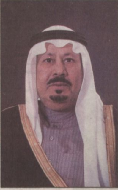
الأمير بدر بن عبدالعزيز

الحرس الوطني صاحب السمو الملكي الأمير عبد الله بن عبدالعزيز سلمه الله.. فكل إنجاز حازه الحرس الوطني وكل مشروع حضاري يتبناه.. وكل مرفق أو مركز ينشئه إنما كان ذلك بفضل الله أولاً ثم بدعمها وتأييدها حفظهم الله.. فلولا ذلك ما تحقق الحرس الوطني هذا المستوى المميز من القوة والافتقار والتميز..