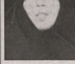
فائزة رفسنجاني زارت مركز الأمير سلمان الاجتماعي

الرياض - و.أ.س: استقبل صاحب السمو الملكي الأمير سعود الفيصل وزير الخارجية بمكتب سموه امس عضو مجلس الشورى رئيسة اللجنة الاولمبية في الجمهورية الاسلامية الايرانية فائزة رفسنجاني التي تزود المملكة حاليا. وجرى خلال المقابلة بحث أوجه العلاقات بين البلدين والقضايا ذات الاهتمام المشترك. وحضر المقابلة الوفد الرفاق وسفير