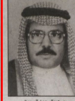
الامير متعب بن عبدالله