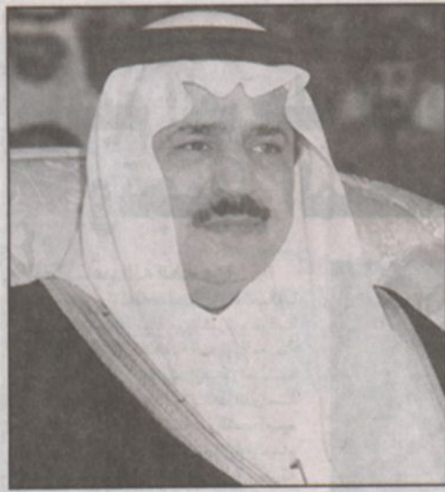
الأمير نايف بن عبدالعزيز

ريال سعودي عن طريق الشحن البحري الى جانب كميات كبيرة من الحليب. وفي مجال الاعاشة قامت اللجنة السعودية المشتركة بكفالة واعاشة اللاجئين الكوسوفيين الذين يسكنون مؤقتا مع العوائل اللبنانية وقد بلغ عدد الافراد الذين تمت كفالتهم (١٤٠٠٠) كما تم تقديم الاعاشة الكاملة للاجئين في المواقع التي تشرف عليها اللجنة في أنحاء متفرقة من البانيا ومقدونيا وبلغ عدد اللاجئين في تلك المواقع أكثر من سبعة عشر الفا وشانناثة وثمانين لاجنا (١٧.٨٨٠) وبذلك يبلغ إجمالي الوجبات التي تقدم يوميا في اللاجئين ما يقرب من تسعين الف وجبة. وقدمت اللجنة الاعاشة الطارئة لمن قطعتم بهم السبل وقد بلغ عدد المستفيدين من هذه الخدمة ما يقرب من خمسة وخمسين الف شخص وتم توزيع هذه الوجبات من خلال الهيئات الاغاثية السعودية العاملة هناك عند بداية الأزمة.