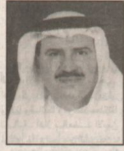
منسوبو درفلة الصلب واجمل عبارات الشكر والثناء لسمو ولي العهد

بسرني بمناسبة زيارة صاحب السمو الملكي الأمير عبدالله بن عبدالعزيز ولي العهد نائب رئيس مجلس الوزراء ورئيس الحرس الوطني للجبيل الصناعية نيابة عن منسوبي الشركة للتحفة لدرفلة الصلب المحفورة ان تقدم لسمو الكريم بأجمل عبارات الشكر والثناء والتقدير لتفهمه بالافتتاح وتشهد الشروعات الصناعية التي لم تتحقق لولا حرص فادة هذه البلاد على ان تظل بلادنا في مقدمة الدول الكبرى في مجال التصنيع والانتاج ويهذه المناسبة اقدم عرضاً موجزاً عن الشركة: