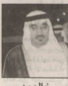
خالد بن عبدالعزيز البراك *

تسعد محافظة الاحساء هذه الأيام بالزيارة اليمومة لصاحب السمو الملكي الأمير عبدالله بن عبدالعزيز ولي العهد ونائب رئيس مجلس الوزراء ورئيس الحرس الوطني - حفظه الله - وتأتي هذه الزيارة امتداداً للزيارات المتوالية لمناطق ومحافظة بلادنا الحبيبة وهي تأكيد على حرص القيادة على التواصل مع شعبيها وتقدير احتياجاته والمشاركة في افتتاح المشاريع التنموية. ففي الأسس القريب كان سموه يفتتح حفل الشبية الذي بشر بمولد احتياطي نظفي كبير يضاهي الاحتياطي السابق لهذه الأرض المباركة. كم نحن سعداء بهذه الزيارة وهذه المنفعة وأهلها أسعد فأهلاً بك يا صاحب السمو بين أهلك ومواطنيك أهلاً بك دافعاً لعجلة التنمية التي لم تتوقف رغم ما شهدت الساحة العالمية من انهيارات اقتصادية وتناميات عانت منها أم سبقتنا في المحافل الاقتصادية الدولية ورعى الله خادم الحرمين الشريفين قائداً لهذه المسيرة المباركة.