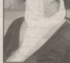
ب. القلم / الشيخ سعد المنقور

تشكل زيارة صاحب السمو الملكي الأمير عبدالله بن عبدالعزيز ولي العهد نائب رئيس مجلس الوزراء ورئيس الحرس الوطني لحفاظة الاحساء فرصة مناسبة عظيمة يعبر فيها المواطنون كبيرهم وصغيرهم لسموه الكريم عما يكونونه في قلوبهم ومشاعرهم من حب وتقدير لسموه وقيادتنا الحكيمة ولاشك ان رعاية سموه حفظه الله للمشاريع التنموية المختلفة في المحافظة انما تعبر عن عظيم تقديره لكل ما يخدم الوطن والمواطن إضافة الى ان هذه المشاريع سوف تعود بالفائدة لا على الاحساء فحسب وانما للوطن ككل وسوف تتيح هذه المشاريع بمشيئة الله الفرصة أمام شباب وبنائه الوطن لايجاد فرص عمل. ونحن في الاحساء الوفية والمحبة نشعر بسعادة عظيمة اليوم بقدوم سموه حفظه الله. فأهلاً بسموه وصحبه الكرام.