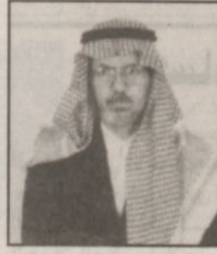
د. سعد بن عبدالله البراك *

تأتي زيارة صاحب السمو الملكي الأمير عبدالله بن عبدالعزيز ولي العهد نائب رئيس مجلس الوزراء ورئيس الحرس الوطني لتأكيد وتوثيق العطاء المستمر من لدن حكومتنا الرشيدة بقيادة خادم الحرمين الشريفين الملك فهد بن عبدالعزيز حفظه الله ورعايته في كل من شأنه تنمية محافظة الاحساء ورفع مستوى الخدمات بها نحو الأفضل انما زيارة الحب والخير والعطاء وانما ليسعد كافة المواطنين بالاحساء ان يروا سموه الكريم واضعاً حجر الأساس لهذه المشاريع الحيوية الهامة. ولعل من أبرز هذه المشاريع واحمها مشروع ابدال مياه الشرب الحالية الى المحافظة لتسهم هذه المياه بإن الله في حل مشكلة نقص المخزون المائي بالطبقات الحاملة ولكي تتوفر المياه الجوفية للأغراض الزراعية وبذا تظل واحة الاحساء قاعدة زراعية على مر العصور. كما ان وضع سموه الكريم لحجر الأساس لبعض المشاريع التابعة لشركة الاحساء للتنمية تعتبر لفحة كريمة ورعاية متواصلتة من لدن سموه لدفع القطاع الخاص الى المزيد من العطاء والتفاعل مع الخطط التنموية الطموحة التي رسمتها حكومتنا الرشيدة سدد الله الخطى وبارك لنا نهضتنا الشامخة.