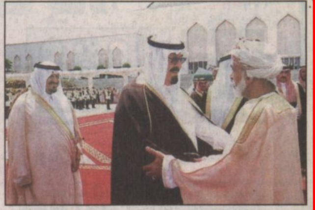
سمو نائب خادم الحرمين يستقبل السلطان قابوس (و.ا.س)