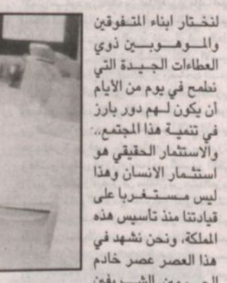
جانب من الطلاب في المجمع

وسيؤدي استثمار هذا المجمع الضخم إلى الوصول لتحقيق الأهداف التربوية المنشودة أداء وعطاء وسلوكاً.