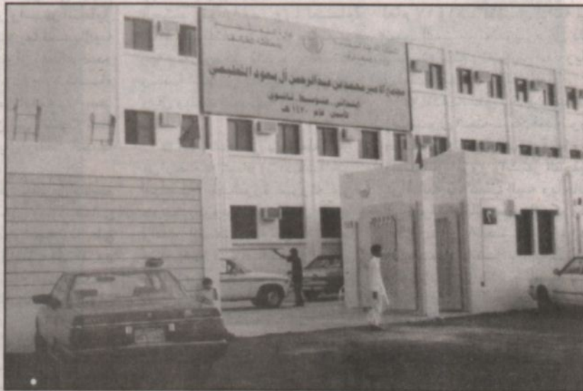
مجمع مشروع المجمع