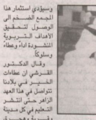
جانب من الطلاب في المجمع