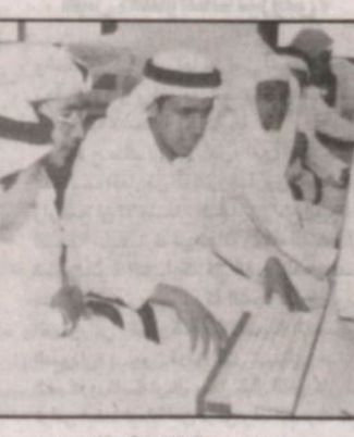
جانب من الطلاب في المجمع