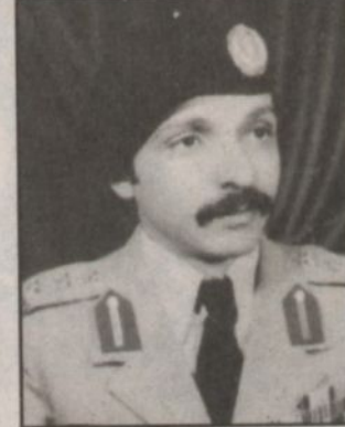
العقيد سعد الحارثي

سموه الكريم لعدد من مناطق ومحافظة المملكة وكانت جميعها حافلة بالبذل والعطاء لراحة المواطن أينما كانوا، وقال ان صاحب السمو الملكي ولي العهد الأمين عودنا على الحضور للطائف حاملاً الخير والنماء لمصيف المملكة الأول وقد قام خلال العام الماضي بافتتاح مشروع كهرباء جنوب الطائف والتي ساهمت في اطلاق التيار الكهربائي لعشرات القرى جنوب المحافظة كما دشّن مستشفى الطائف التخصصي والذي تحول إلى واقع ملموس وسيساهم في تطور الخدمات الطبية المقدمة للمواطنين.