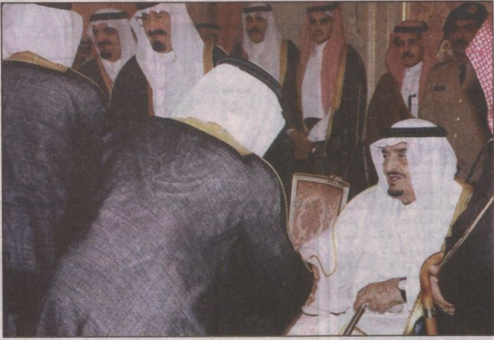
أعضاء مجلس الشورى يتشرفون بالسلام على خادم الحرمين الشريفين (جدة و.ا.س)