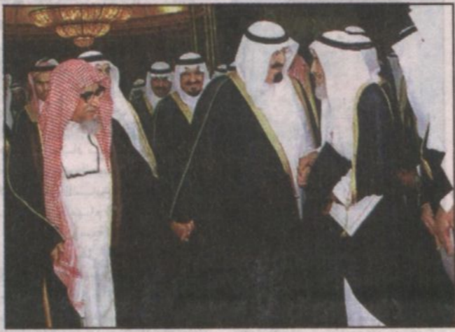
سمو ولي العهد يرحب بالدكتور العثيمين وبعائنه الشيخ ابن جبير (جدة واس)