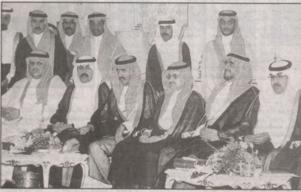
عدد من أصحاب السمو الأمراء في الحفل جدة