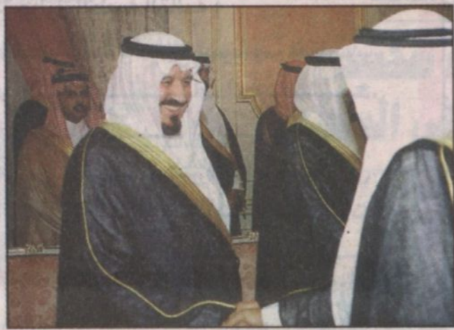
الأمير سلطان بن عبدالعزيز يصافح أعضاء مجلس الشورى (جدة واس)