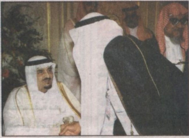
خادم الحرمين يصافح أعضاء مجلس الشورى

الجامعة الوليدة. إن ما تحقق لبلادنا من نهضة شاملة في المجالات التعليمية والصحية والصناعية والزراعية وقطاع المواصلات والاتصالات وتحلية المياه وبناء العشرات من السدود وغيرها ما كان ليتم لولا توفيق الله عز وجل ثم العمل ليل نهار بسواعد أبناء الوطن الذين أعادتهم الدولة عن طريق البناء السليم والاستثمار الأمثل لقدراتهم وامكانياتهم. نود أن نشير بكتير من الاهتمام إلى الضغوط العريضة التي وضعت للمحافظة على المياه وترشيد استهلاكها - وكانت ثمرة تعاون مجلس الوزراء ومجلس الشورى خلال العام المنصرم مؤكداً في الوقت نفسه على أهمية دور المواطن والمقيم في تنفيذ تلك الأهداف سواء في مجال مياه الشرب أو مياه الري الزراعي.