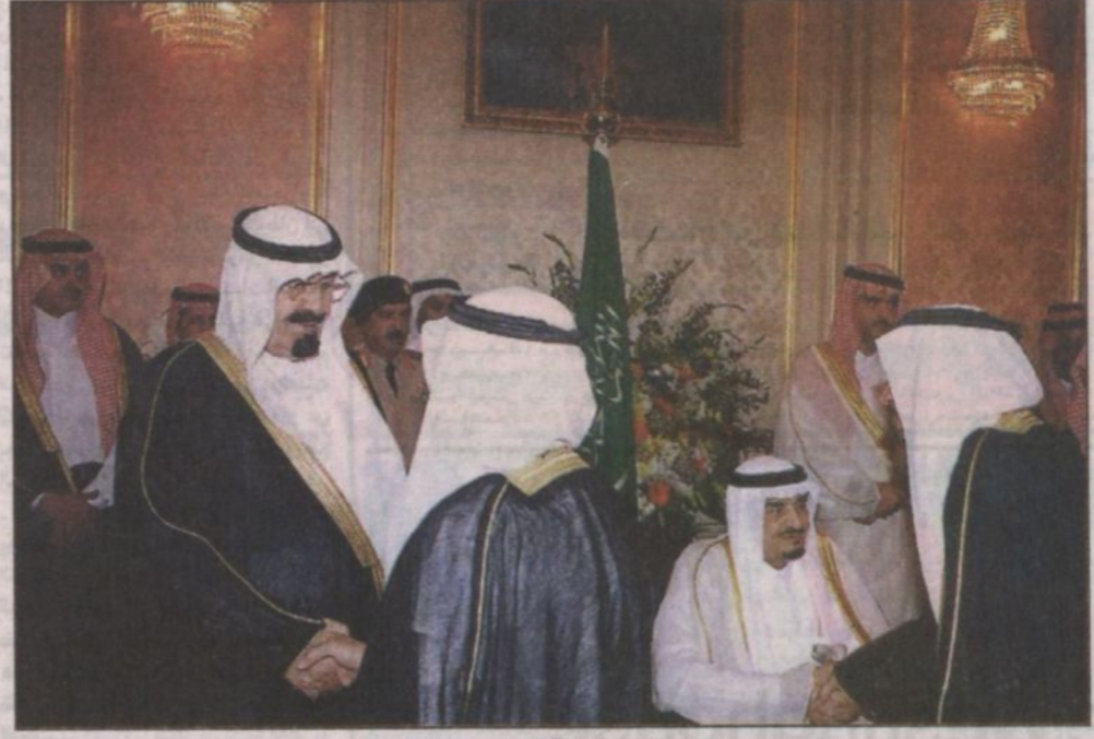
خادم الحرمين يستقبل كبار المسؤولين وأعضاء مجلس الشورى (جدة و.ا.س)

ما كنا جميعاً نصبو إليه من الرأي السديد، والمشورة الخلقية، والقرارات المبنيه عن الأهواء والمزایدات والمشاحنات.