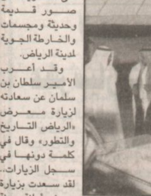
بقلم: مطيع التونو

كتب - إبراهيم الدعبلج: قام صاحب السمو الملكي الأمير سلطان بن سلمان بن عبدالعزيز ظهر أمس بزيارة لمعرض «الرياض التاريخ والتطور» الذي تنظمه أمانة مدينة الرياض بصالتها بطريق صلاح الدين الأيوبي أمام حديقة أبو مخروق بالمز حيث كان في استقباله معالي أمين مدينة الرياض الدكتور عبدالعزيز بن محمد بن عياف آل مقرن والمهندس صالح الدميحي مدير عام التنفيذ والإشراف المشرف على المعرض والمهندس محمد الضنيبان مدير إدارة المعارض بالأمانة وعدد من السؤولين. حيث تجول سموه في أرجاء المعرض واطلع