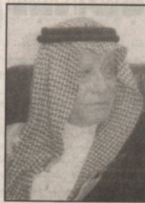
بقلم: مطيع التونو

تتميز مدرسة الملك عبدالعزيز بن عبد الرحمن آل سعود طيب الله ثراه، بالشجاعة الخارقة، والبطولة الفاتحة، والعزيمة الصادقة، الممزوجة بكل الحب والتقدير لرجالها المخلصين وبالصبر والحكمة لتخفي كل الصعاب التي تعترض سبيل التطور والتنمية لشبه الجزيرة العربية.