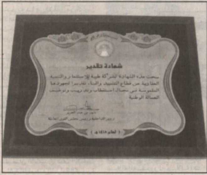
مدير عام مصنع مياه طبية