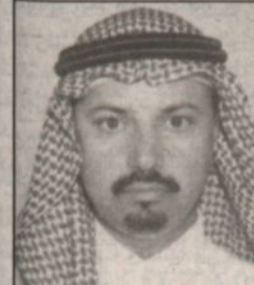
عبدالله محمد الزيد

تتشرف طيبة الطبية وحافظاتها وقراها ومجراها بالزيارة التقديرية التي يقوم بها صاحب السمو الملكي الأمير عبدالله بن عبدالعزيز ولي العهد ونائب رئيس مجلس الوزراء ورئيس الحرس الوطني لها، فهذا اليوم من أعز الأيام التاريخية لعنيدة الرسول ﷺ حيث يتشرف أهالي منطقة المدينة المنورة وعلى رأسهم أمير منطقة المدينة المنورة صاحب السمو الملكي الأمير عبدالمجيد بن عبدالعزيز - حفظه الله - باستقبال سموكم الكريم في هذه الزيارة الميمونة للمنطقة.