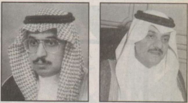
الأمير سعود بن نايف