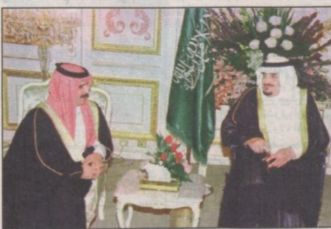
خادم الحرمين يستقبل أمير البحرين

الرياض - واس: استقبل خادم الحرمين الشريفين الملك فهد بن عبدالعزيز آل سعود في قصر اليمامة مساء أمس أخاه صاحب السمو الشيخ حمد بن عيسى آل خليفة أمير دولة البحرين والوفد المرافق له. وقد تم خلال المقابلة بحث العلاقات الثنائية بين البلدين الشقيقين واستعراض شامل لمجمل الأوضاع على الساحتين الخليجية والعربية والإسلامية والدولية. وقد أقم خادم الحرمين الشريفين الملك فهد بن عبدالعزيز آل سعود حفل عشاء تكريماً لأخيه صاحب السمو الشيخ حمد بن عيسى آل خليفة أمير دولة البحرين والوفد المرافق له. وحضر حفل العشاء صاحب السمو الملكي الأمير سلطان