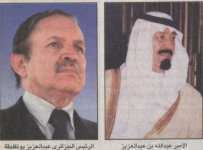
الأمير عبدالله بن عبدالعزيز الرئيس الجزائري عبدالعزيز بوتفليقة

كتب - أحمد الجميعة: يبدأ صاحب السمو الملكي الأمير عبدالله بن عبدالعزيز ولي العهد نائب رئيس مجلس الوزراء رئيس الحرس الوطني بعد غد (الاثنين) زيارة رسمية الى الجمهورية الجزائرية الديمقراطية الشعبية بدعوة من فخامة الرئيس عبدالعزيز بوتفليقة الذي سيكون على رأس مستقبلي سموه لدى وصوله الجزائر.