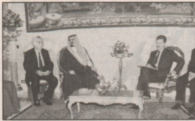
زيارة سمو الأمير عبد الله لرئيس الوزراء الإيطالي