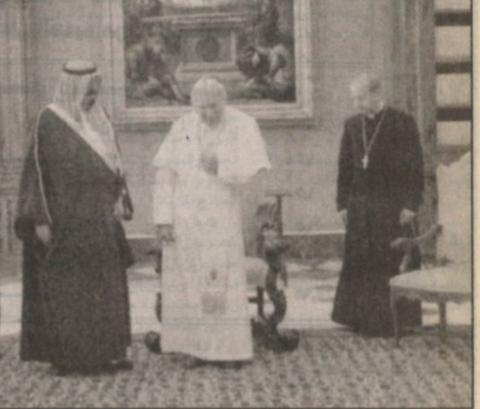
سمو الأمير عبد الله ورئيس الوزراء الإيطالي

موسيمو ديلا ما شيوغي، بل وأول شيوعي يترأس حكومة أوروبية غربية، وذلك بعد انهيار النظام الشيوعي في عرينه بالاتحاد السوفيتي بقرابة عشر سنوات، ولكن ذلك لا يمنع الاتصال به والتباحث معه بشأن العلاقات الثنائية والدولية، كما حصل في زيارات أخرى متبادلة مع الصين التي لا تزال شيوعية، وإقامة علاقات دبلوماسية مع روسيا الاتحادية التي كانت معقلاً للشيوغية ولا يزال الشيوعيون يشكلون قوة سياسية كبيرة فيها، لا سيما بسبب الأوضاع المعاشية والاقتصادية المتردية التي يستعجلها الحزب الشيوعي لتحقيق مكاسب سياسية. لاشك أن الشيوعية الإيطالية مختلفة عن باقي أنماط الشيوعية، فهو أول حزب شيوعي دعا إلى التحرر من الهيمنة السوفيتية واستحدث النموذج الوطني منه، واستحق بذلك غضب المنظمة الأممية، ولكن حركة التاريخ أثبتت فشل فكرة تصدير الثورة لأنها قُطعت في الاتحاد السوفيتي، وأثبتت نجاح التجارب الأصلية المنبعثة من واقع الأمم والشعوب، حيث إن الحزب الشيوعي الإيطالي هو الحزب الشيوعي الوحيد الذي وصل إلى السلطة في أوروبا الغربية، كما أن التجربة الصينية كانت حرة ومستقلة عن النموذج السوفيتي لتصدير الثورات، لذا فإنه لم يعبر الثوابت الأساسية بل عمق التوجهات الاجتماعية له بمساعدة الطبقات الأقل رخاءاً، وتوفير فرص العمل، ومحاربة الفساد والاستغلال.