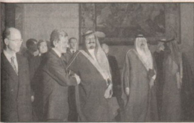
جانب من لقاء الأمير عبد الله مع رئيس الوزراء الإيطالي