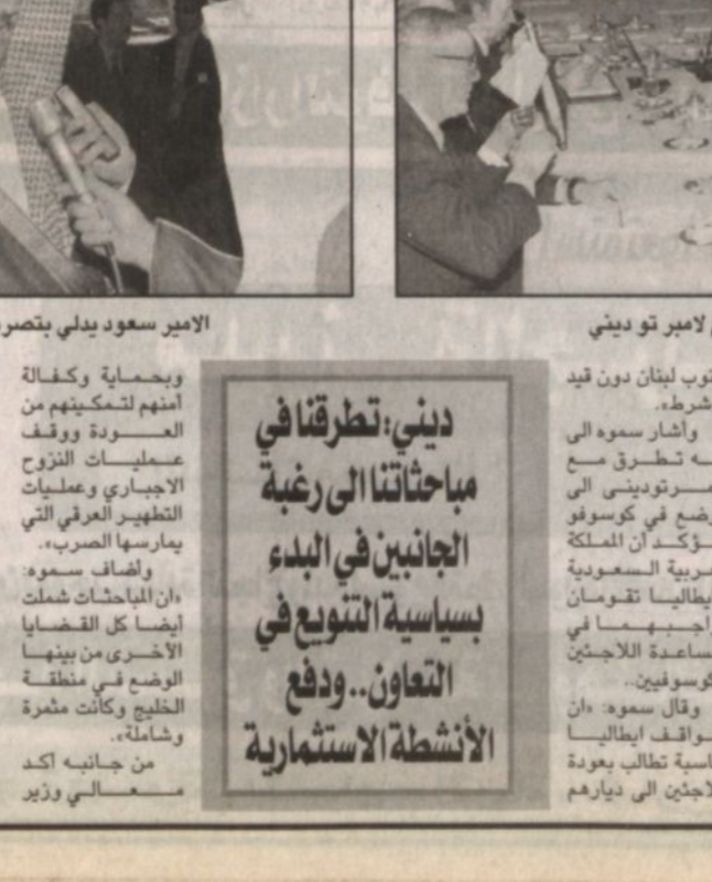
زيارة سمو ولي العهد للفاتيكان ولقاءه بالبابا