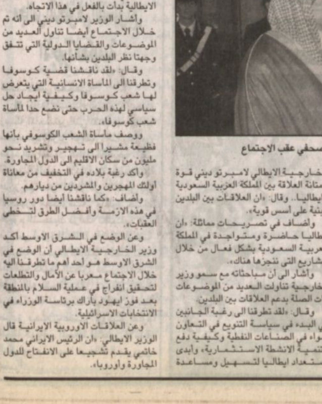
جانب من لقاء سمو الأمير عبد الله مع رئيس الوزراء الإيطالي

ووصف مأساة الشعب الكوسوفي بأنها طبيعية مشيراً الى تشجيعه وتشديد نحو مليون من سكان الاقليم الى الدول المجاورة. وأكد رغبة بلاده في تحقيق من معاناة أولئك المهجورين والمشردين من ديارهم. وأضاف: «كما ناقشنا أيضاً دور روسيا في هذه الأزمة وأفضل الطرق لتخطي العقبات».