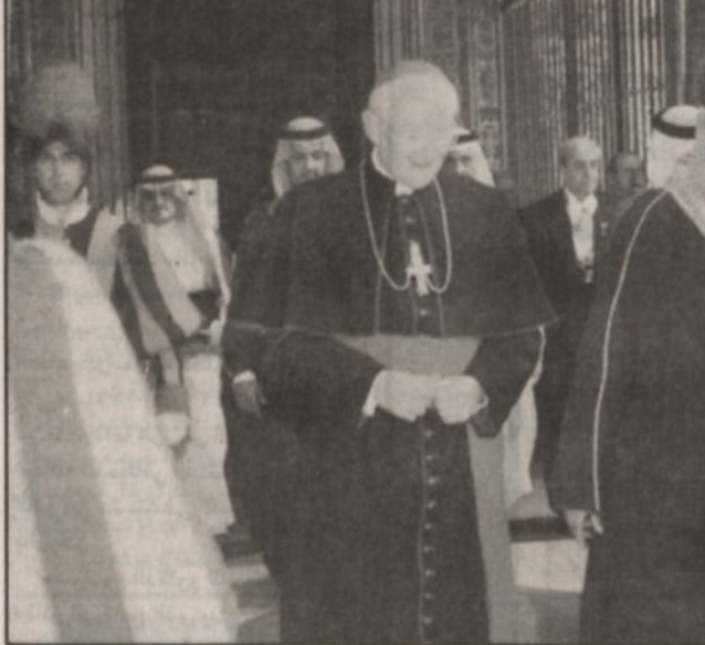
جانب من لقاء سمو الأمير عبد الله مع رئيس الوزراء الإيطالي