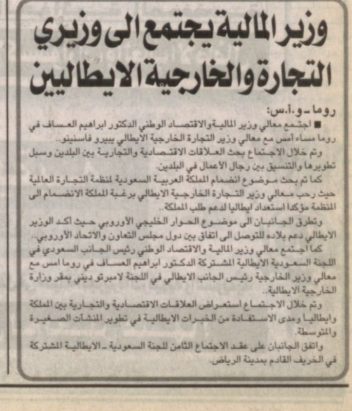
سمو الأمير عبد الله ورئيس الوزراء الإيطالي

وأشار سموه الى أنه تم خلال الاجتماع بحث إياه في الشرق الأوسط. وقال: «لما تم بحث قضية القدس التي