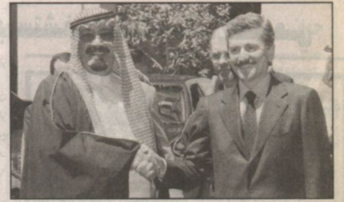
سمو الأمير عبد الله ورئيس الوزراء الإيطالي