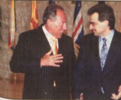
الرئيس اللبناني خلال استقباله الأمير الوليد في إحدى زيارته للبنان

المناطق اللبنانية ويوفر الاسعافات الأولية مباشرة على الارض او ضمن دوات تدريبية متواصلة ويعتبر الصلص المعاصر الآمن لتأمين وحدات الدم الى المحتاجين كما يؤمن الرعاية والدعم للمعوقين والأطفال ضمن المراكز اللبنانية وهو يؤمن العديد من الخدمات الصحية في كافة