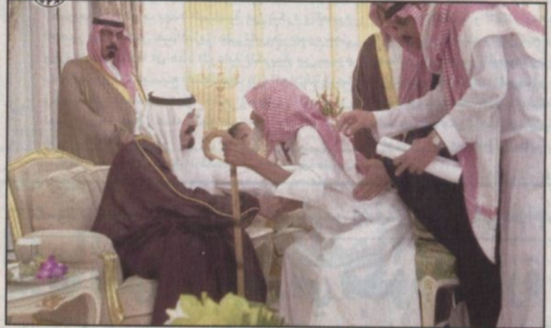
سمو ولي العهد يستقبل جموعاً من المواطنين (واس)

الطائف - (واس) ■ استقبل صاحب السمو الملكي الأمير عبدالله بن عبدالعزيز ولي العهد نائب رئيس مجلس الوزراء ورئيس سمو محافظ الطائف أمس أصحاب السمو الملكي الأمراء وسماحة مفتي عام المملكة ورئيس هيئة كبار العلماء وإدارة البحوث العلمية والإفتاء الشيخ عبدالعزيز بن عبدالمطلب بن عبدالعزيز آل الشيخ وفضيلة رئيس مجلس القضاء الأعلى الشيخ صالح بن محمد اللحيدان وأصحاب الفضيلة العلماء والمشايخ وأصحاب المعالي الوزراء ورؤساء الدوائر الحكومية بمحافظة الطائف وجمعاً من المواطنين الذين قدموا للسلام على سموه وتمنته سلامة الوصول إلى محافظة الطائف حضر الاستقبال صاحب السمو الأمير محمد بن عبدالله بن جلوي وصاحب السمو الملكي الأمير متعب بن