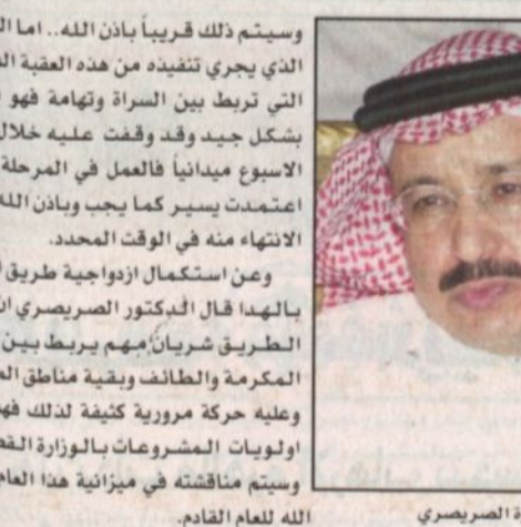
د. جبارة الصيرفي

وسيمت ذلك قريباً بأذن الله... أما الجزء الذي يجري تنفيذه من هذه العقبة المهمة التي تربط بين السراة وتهامة فهو يسير بشكل جيد وقد وقفت عليه خلال هذا الأسبوع ميدانياً فالعمل في المرحلة التي اعتمدت يسير كما يجب وبإذن الله يتم الانتهاء منه في الوقت المحدد. وعن استكمال ازدواجية طريق الكرا بالهنا، قال الدكتور الصيرفي ان هذا الطريق شرياناً مهم يربط بين مكة المكرمة والطائف ويقيه مناطق المملكة وعليه حركة مرورية كثيفة لذلك فهو من أولويات المشروعات بالوزارة القصوى وسيتم مناقشته في ميزانية هذا العام بإذن الله للعام القادم.