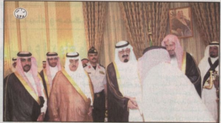
سمو ولي العهد يستقبل الأمراء وأصحاب الفضيلة العلماء والمشايخ