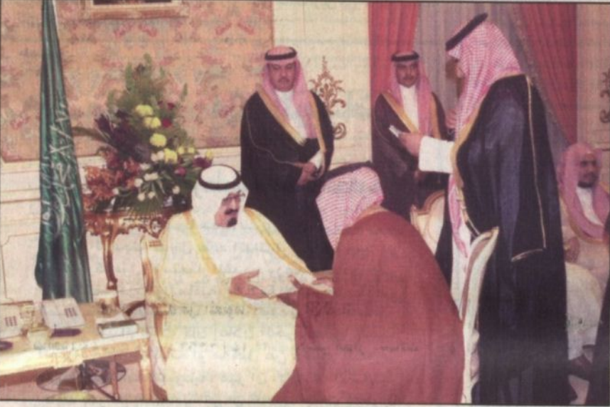
الأمير عبدالله خلال الاستقبال (واس)

جدة - واس، استقبل صاحب السمو الملكي الأمير عبدالله بن عبدالعزیز ولي العهد نائب رئيس مجلس الوزراء ورئيس الحرس الوطني في الديوان الملكي بقصر السلام أمس أصحاب السمو الملكي الأمراء وكبار المسؤولين وجمعاً من المواطنين الذين قدموا للسلام على سموه. وتشرف بالسلام على سمو ولي العهد معالي رئيس مجلس هيئة السوق المالية الأستاذ جمال بن عبدالله السحيمي بمناسبة صدور الأمر الملكي الكريم بتعيينه رئيساً للمجلس بمرتبة وزير. كما تشرف بالسلام على سموه الدكتور محمد بن عبدالحرمين البشر بمناسبة تعيينه سفيراً لخادم الحرمين الشريفين لدى المملكة المغربية الشقيقة. وقد استمعوا إلى توجيهات سمو ولي العهد وتمنياته لهم بالتوفيق في أعمالهما.. وقد أضرنا عن اقتراحهما بالثقة الكريمة داعمين الله أن يوفقهما لخدمة الدين ثم المليك والوطن وأن يحققا تطلعات ولاة الأمر. حضر الاستقبالات صاحب السمو الأمير سعد بن عبدالله بن تركي وصاحب السمو الأمير فواز بن عبدالله بن عبدالحرمين.