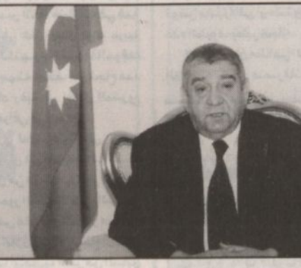
السفير الأذري يتحدث للصحافيين في مقر سفارة بلاده بالرياض

السياسي والاجتماعي وتوفير الامن قد وفر أرضية صلبة ومنافخاً مناسباً لجلب وتشجيع الاستثمارات الأجنبية. وأضاف أن قطاع صناعة النفط حظي بالنصيب الأوفر من مجمل الاستثمارات. وأعرب عن شكر بلاده لمواقف المملكة في دعمها لأذربيجان خصوصاً فيما يتعلق بقضيتها أمام الحروب الأمريكية. وفيما يتعلق بالقضية الفلسطينية أكد السفير الأذربيجاني دعم بلاده للشعب الفلسطيني محرباً عن استنكاره للعدوان الإسرائيلي الأثم والمتواصل. وقال في نهاية حديثه للصحافيين إن أذربيجان تربطها بالدول العربية والإسلامية علاقات تاريخية وثقافية ودينية مشيرة إلى أن المنطلق إلى أن أذربيجان تؤكد حرصها واستعدادها لتطوير وتعزيز علاقاتها مع الدول العربية والإسلامية المبنية على احترام سيادة الدول ومصالحها الوطنية.