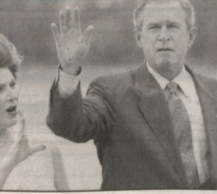
بوش وزوجته لورا لدى وصولهما إلى واکو في ولاية كونيكتكات.

واشنطن، كشف استطلاع للرأي العام نشرته صحيفة (واشنطن بوست) الأمريكية أمس عن انخفاض جديد في شعبية الرئيس الأمريكي جورج بوش وذلك قبل خمسة شهور فقط من الانتخابات الرئاسية المقرر إجراؤها في نوفمبر (تشرين الثاني). عبر ٥٠ بالمئة ممن شملهم الاستطلاع عن عدم موافقتهم على الأداء العام لبوش بينما عبر ٤٧ بالمئة عن موافقتهم على أدائه وهو أدنى مستوى من التأييد لبوش في الاستطلاعات التي أجرتها صحيفة واشنطن بوست و«إيه.بي.سي» الإخبارية منذ تولي بوش منصبه في يناير (كانون الثاني) ٢٠٠١. ووفقاً للاستطلاع أعطى أربعة فقط من بين كل عشرة أمريكيين شملهم الاستطلاع تقييماً إيجابياً للطريقة التي يعالج بها بوش الوضع في العراق وهو أدنى مستوى منذ بداية الحرب على العراق في مارس آذار العام الماضي. وذكرت صحيفة واشنطن بوست، أن نسبة التأييد لبوش الشهر الماضي كانت ٥١ بالمئة. ووفقاً لهذا الاستطلاع فإن هذا التراجع في شعبية بوش يعود بصورة كاملة تقريباً لنقص نسبة التأييد له بنسبة سبع نقاط مئوية بين الجمهوريين. ووجد الاستطلاع أن بوش في وضع تنافسي حاد متعادل مع السناتور جون كيري مرشح الحزب الديمقراطي في سباق الرئاسة. وأوضح أن ٤٦ بالمئة ممن لهم حق التصويت قالوا أنهم سيعطون أصواتهم لبوش إذا أُجريت الانتخابات اليوم وقال ٤٦