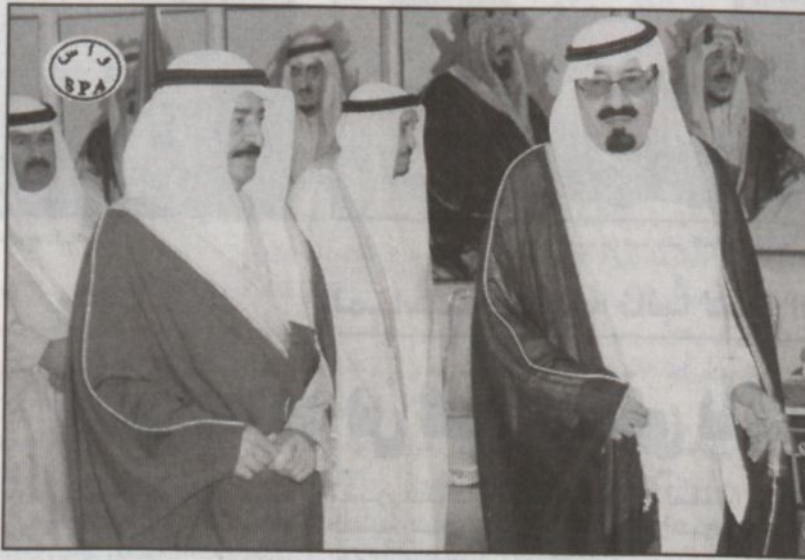
الأمير عبدالله يستقبل الشيخ خليفة (و.أس)

الاستخبارات العامة وصاحب السمو الملكي الأمير محمد بن نواف بن عبدالعزيز سفير خادم الحرمين الشريفين لدى إيطاليا وصاحب السمو الملكي الأمير مشعل بن ماجد بن عبدالعزيز محافظ جدة وصاحب السمو الملكي الأمير محمد بن نايف بن عبدالعزيز مساعد وزير الداخلية للشؤون الأمنية وصاحب السمو الملكي الأمير عبدالعزيز بن عبدالله بن عبدالعزيز نائب وزير الدفاع والطيران والمفتش العام وصاحب السمو الملكي الأمير محمد بن نايف بن عبدالعزيز مساعد وزير الداخلية للشؤون البلدية والقروية وصاحب السمو الملكي الأمير نواف بن عبدالعزيز سفير خادم الحرمين الشريفين لدى البحرين والمفتش العام للشؤون الخارجية والسفير البحريني لدى المملكة راشد بن سعد الدوسري.