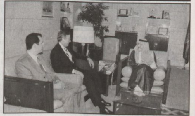
الأمير سطان بن عبدالعزيز

جدة - واس، بعث خادم الحرمين الشريفين الملك فهد بن عبدالعزيز آل سعود برقية تهنئة إلى جلالة الملك جيانديرا بيريكرام شاه ديف ملك نيبال بمناسبة ذكرى اليوم الوطني لبلاده. وأعرب الملك المفدى باسمه واسم شعب وحكومة المملكة العربية السعودية عن أطيب التهاني وأصدق التمنيات بالصحة والعافية لجلالته والازدهار لشعب نيبال الصديق. وأعاد حفظه الله بالعلاقات التي تربط المملكة ونيبال وشعبيهما الصديقين.