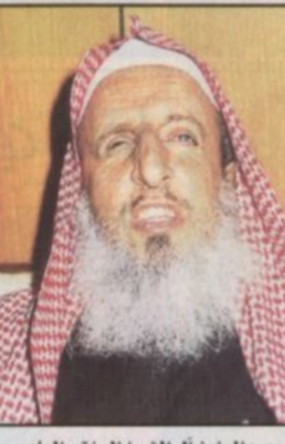
عبدالعزير آل الشيخ المفتي العام

ممارسة هذا النوع من العلاج، مؤكدا وجود قسم للتوعية الدينية بكل مستشفى يقوم بتوفير قراء الخدمة المرضى النفسيين المنومين فيها. وأضاف عبدالغني ان الأحداث الراهبية الأخيرة نتج عنها زيادة في عدد المرضى النفسيين جراء الخوف من اعمال اللغنة الضالة من قتل وترويع للحالات مشيراً الى ان هناك حالة اضطراب وقلق نفسي وانطواء