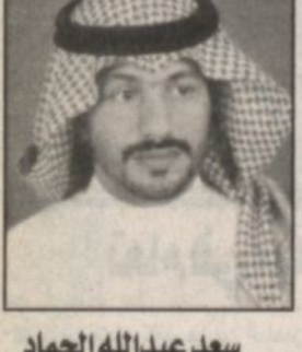
سعد عبدالله الجماد

■ أهلاً بطيب النفس رحيم القلب رجل البر والخير مرحباً بضيافته السرية.. هي عبارات مشاعرية صادقة.. إزدانت.. وتوشحت بها الميامين والشوارع في محافظة الحريق فرحاً وابتهاجاً واستقبالاً لصاحب السمو الملكي الامير عبدالله بن عبدالعزيز ولي العهد نائب رئيس مجلس الوزراء رئيس الحرس الوطني بمناسبة زيارته الميمونة لمحافظة الحريق والتي سيقفل بها حفظة الله بافتتاح بعض المشاريع التنموية ومشاركة المواطنين أفراحهم تلك العبارات توضح حمية العلاقة بين هذا الشعب والقيادة الرشيدة بقيادة سموه خادم الحرمين الشريفين - حفظة