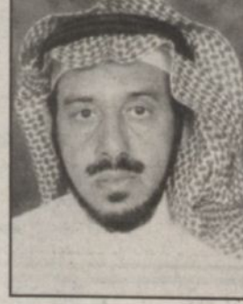
محمد بن ناصر الكثيري

■ عندما هم الملك عبدالعزيز - رحمه الله - بتوحيد البلاد وجمع شتاتها استعان بالله الواحد القهار على تكوين وحدة إسلامية اقليمية راسخة على مر الأزمان أساسها العقيدة السلفية والنهج الحمدي القويم كان من تلك البقاع التي فتحتها الملك عبدالعزيز بلد الحريق وكانت بلاداً ساخنة تضم قبائل متفرقة شأنها شأن بقية المناطق في الجزيرة العربية والحريق غنية بخصوبة أرضها وعذوبة مائها وكثرة مسابغاتها، فقدم إليها الملك عبدالعزيز ليضمها إلى عقد اللؤلؤ