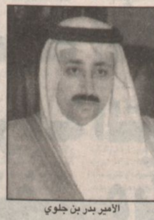
الأمير بدر بن جلوي

المسابقة التشكيلية بصالة جمعية الثقافة والفنون بالأحساء الساعة ٧,٣٠ مساءً. -الأثنين ١٤٢٠/٨/٢٦ هـ المسابقة الثقافية المشتركة بمركز النخبة الاجتماعية بمقر نادي ريف جواتا بالكلاية الساعة ٧,٣٠ مساءً. -الثلاثاء ١٤٢٠/٨/٢٧ هـ مهرجان الطفل الترفيهي بالتعاون مع الندوة العالمية للشباب الإسلامي «مدارس دار العلوم بالفوف الساعة ٥,٣٠ مساءً. -الأربعاء ١٤٢٠/٨/٢٢ هـ والخميس ١٤٢٠/٨/٢٤ هـ عرض مسرحي لمسرحية الشباب - القبو - التي مثلت الملكة في الأسبوع الثقافي بالشارقة وذلك على مسرح جمعية الثقافة والفنون بالأحساء الساعة ٧,٣٠ مساءً. -الجمعة ١٤٢٠/٨/٢٥ هـ الحفل الختامي للأسبوع - بصالة بيت الشباب بالأحساء الساعة ٧,٣٠ مساءً.