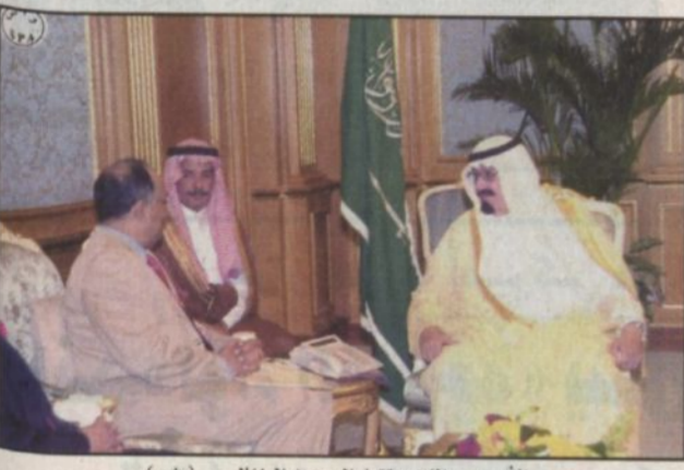
الأمير عبدالله يتسلم المبعوث البنغالي (واس)

جدة - واس - تسلم صاحب السمو الملكي الأمير عبدالله بن عبدالعزيز ولي العهد نائب رئيس مجلس الوزراء رئيس الحرس الوطني رسالة من دولة رئيسة وزراء بنغلاديش خالدة ضياء. وقام بتسليم الرسالة لسمو ولي العهد معالي المبعوث الخاص لدولة رئيسة الوزراء صلاح الدين قادر شودي خلال استقبال سموه له والوفد المرافق في مكتبه بالديوان الملكي في قصر السلام. ونقل المبعوث البنغالي لصاحب السمو الملكي الأمير عبدالله بن عبدالعزيز تحيات وتقدير فخامة رئيس جمهورية بنغلاديش عياض الدين أحمد ودولة رئيسة الوزراء.. كما حملته سمو ولي العهد تحياته وتقديره لقيادة البنغالية. حضر الاستقبال صاحب السمو الملكي الأمير عبد الرحمن بن عبد العزيز نائب وزير الدفاع والطيران والمفتش العام وصاحب السمو الملكي الأمير سعود الفيصل وزير الخارجية وصاحب السمو الملكي الأمير عبد العزيز بن عبدالله بن عبدالعزيز المستشار في ديوان سمو ولي العهد وصاحب السمو الأمير الدكتور بندر بن سلمان بن محمد آل سعود المستشار في ديوان سمو ولي العهد ومعالى المستشار في ديوان سمو ولي العهد الأستاذ عبد المحسن الدين حوجة.