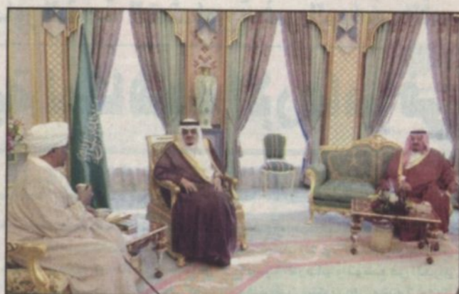
خادم الحرمين الشريفين يستقبل الرئيس السوداني (أ.س.)

جدة - واس - استقبل خادم الحرمين الشريفين الملك عبد الله بن عبدالعزيز آل سعود في مكتبه بقصر السلام أمس فخامة الرئيس عمر حسن البشير رئيس جمهورية السودان. وقد رحب الملك المفدى بأخيه فخامة الرئيس السوداني في بلده الثاني المملكة متمنيا له طيب الإقامة. وقد عبر فخامته لخادم الحرمين الشريفين عن شكره وتقديره للحفاوة التي لقيها منذ وصوله المملكة متمنيا للمملكة دوام التقدم والازدهار. وقد استعرض خادم الحرمين الشريفين وفخامة الرئيس عمر حسن البشير تطورات الأوضاع على الساحة العربية والإسلامية والمالية وخاصة القضية الفلسطينية والوضع في العراق.. كما بحث أيضا التعاون بين البلدين الشقيقين وسبل تطوره في كافة المجالات. حضر الاستقبال صاحب السمو الملكي الأمير عبد الرحمن بن عبد العزيز نائب وزير الدفاع والطيران والمفتش العام وصاحب السمو الملكي الأمير سعود بن عبد العزيز نائب رئيس الاستخبارات العامة وصاحب السمو الملكي الأمير عبد العزيز بن عبد العزيز وزير الدولة وعضو مجلس الوزراء ورئيس ديوان رئاسة مجلس الوزراء ومعالى الديوان الملكي الأستاذ محمد النوير ومعالى المستشار الخاص لخادم الحرمين الشريفين الأستاذ إبراهيم المقرني ومعالى وزير الدولة وعضو مجلس الوزراء الدكتور عبد العزيز الخويطر ومعالى مستشار خادم الحرمين الشريفين الدكتور أسامة