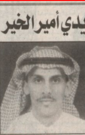
عبدالله بن عبدالعزيز آل حسين

يسعد أهالي المنطقة بشرف زيارة صاحب السمو الملكي الأمير عبدالله بن عبدالعزيز ولي العهد نائب رئيس مجلس الوزراء رئيس الحرس الوطني وصحبه الكرام، وحينما حل سيدي حل الخير - إن شاء الله - وما لاشك فيه أن هذه الزيارة جاءت لتؤكد من جديد على اهتمام حكومتنا الرشيدة بأبنائها في كل بقعة من مملكتنا الغالية.. وما أود الإشارة إليه هنا هو أمل يتحنى جميع أبناء هذه المنطقة تحقيقه وهو طريق يختصر المسافة بين العاصمة الرياض وبين هذه المنطقة والقرى المجاورة لها، والذي يبدأ من منطقة الحابر بالرياض باتجاه الجنوب فينتفذ هذا الطريق سوف يختصر المسافة إلى ما يقارب (٥٠٪) من الطريق القديم تقريباً إضافة إلى أنه سوف يسهم في تخفيف الضغط الشديد الذي يعاني منه الطريق الحالي والذي تسبب في كثير من الحوادث التي راح ضحيتها كثير من أبناء المنطقة. وحكومتنا - حفظها الله - تسعى دائماً وأبداً لما فيه إسعاد المواطن وراحته، وهذا سبب يجعل الأمل كبيراً في تنفيذ هذا الطريق في القريب العاجل إن شاء الله. والسلام عليكم ورحمة الله وبركاته.