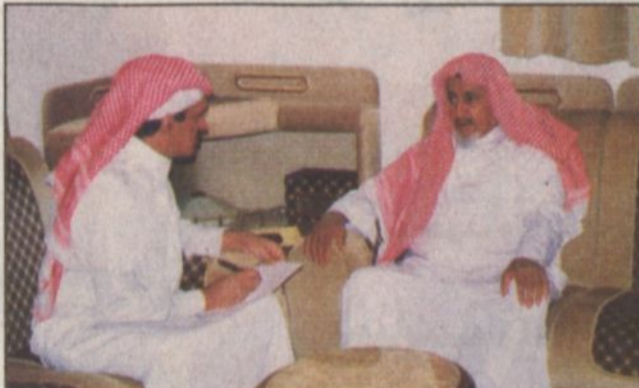
الشيخ سعود يتحدث للزميل الشبابات

المجالات. كيف ترى محافظة الحريق خلال الخمسين سنة الماضية؟ بعدما وجد الملك عبدالعزيز أرجاء هذا الوطن عمل بكل ما في وسعه يؤازره في ذلك ابتناؤه لتطوير البلاد فقد عمت النهضة العمرانية والتعليمية والزراعية والاقتصادية جميع أنحاء المملكة وقد نالت محافظة الحريق نصيبها من هذا التطور في مجالات عديدة بدعم من حكومتنا الرشيدة فقد تيسرت لأهالي الحريق القروض العقارية والزراعية وأنشئت المدارس لتعليم أبناء المحافظة ويوجد بالحريق حالياً إدارات حكومية تقدم خدماتها الجلية للأهالي كما تم تنفيذ المشاريع الحيوية فشهدت الحريق تطورا عمرانياً وتحظى هذه الإنجازات باهتمام شخصي من صاحب السمو الملكي الأمير سلمان بن عبدالعزيز أمير منطقة الرياض سلمه الله.