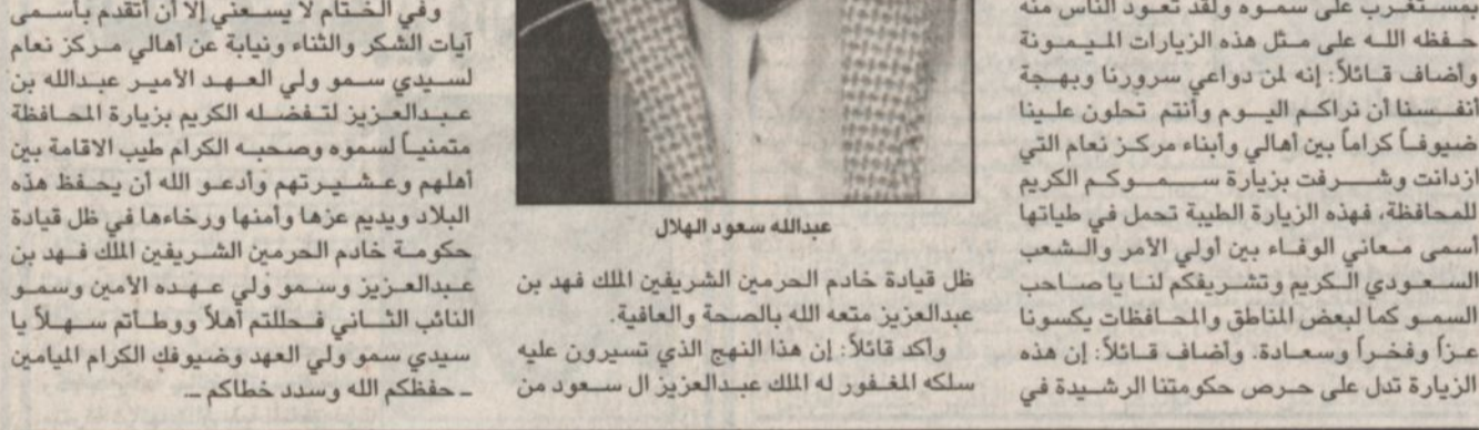
عبدالله سعود الهلال

قلكم طيب الله ثراه وقال ان هذه الزيارة دافعا لعملية التنمية والتطور والبناء والنماء والتعمير في ربوع هذه المنطقة الغالية. وأعرب رئيس مركز نعام عن بالغ سروره وسعاده بهذه الزيارة الكريمة قائلاً: انها بشاره خير وبركة ويكل حب وود وفاء أرحب بسمو ولي العهد وصحبه الميامين ونياية عن أهالي مركز نعام. وأضاف قائلاً: ان هذه الزيارة الميمونة لدليل قاطع على التواصل والتراحم والترابط بين الراعي والرعية. وفي الختام لا يسعني إلا ان اتقدم باسمي آيات الشكر والثناء ونياية عن أهالي مركز نعام لسيدى سمو ولي العهد الامير عبدالله بن عبدالعزيز لتفضله الكريم بزيارة المحافظة متمنياً لسموه وصحبه الكرام طيب الإقامة بين أهلهم وعشيرتهم وأدعو الله أن يحفظ هذه البلاد ويديم عزها وأمنها ورخاءها في ظل قيادة حكومة خادم الحرمين الشريفين الملك فهد بن عبدالعزيز وسمو ولي عهده الأمين وسمو النائب الثاني فحفظت أهلاً ووطنات سهلاً يا سيدى سمو ولي العهد وضيوفك الكرام الميامين - حفظكم الله وسدد خطاكم -